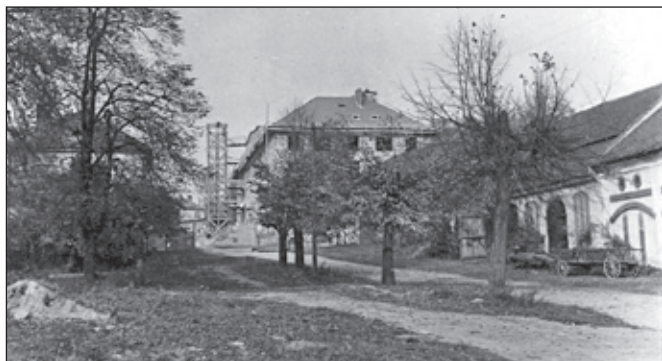
Za sokolovnou bez chat.