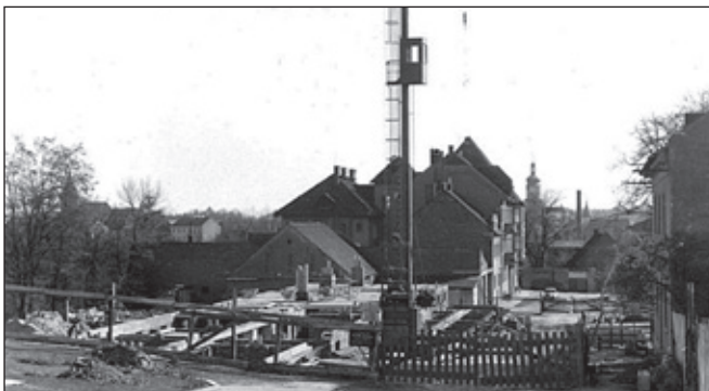
Stavba třetího bytového domu.