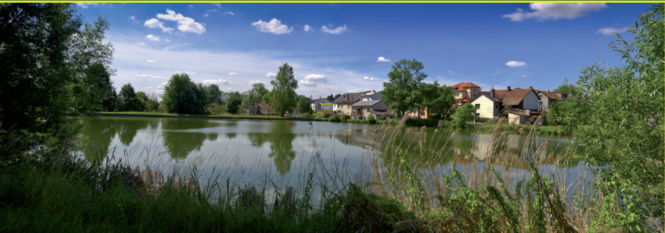
Největší bohoslavický rybník s pěkně upraveným okolím. Jmenuje se Tláskal.