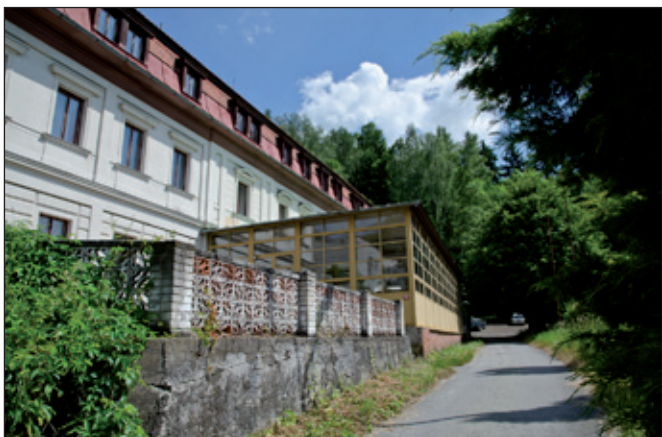
Podzámčí Nové Město nad Metují.