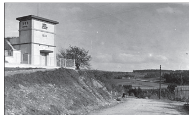
Dobová pohlednice hotelu Rambousek. Rambousek vypálený. Pohled na dostavěný hotel Metuj.