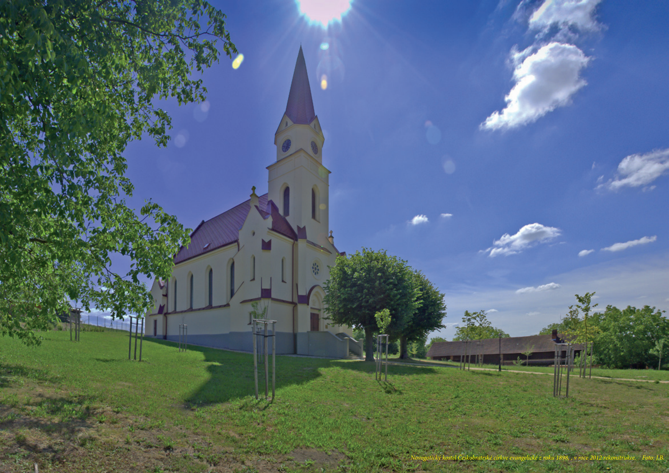
Novogotický kostel Českobratrské církve evangelické z roku 1898, v roce 2012 rekonstrukce.