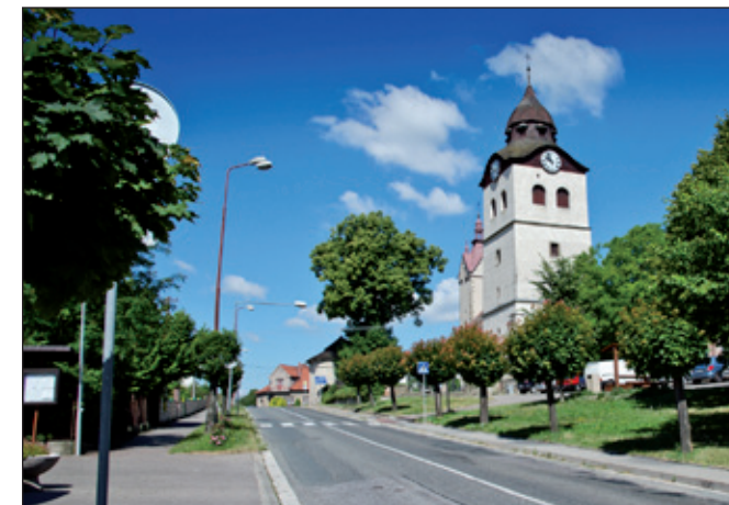
Výjezd z centra Bohuslavic k železniční zastávce a na Hradec Králové.