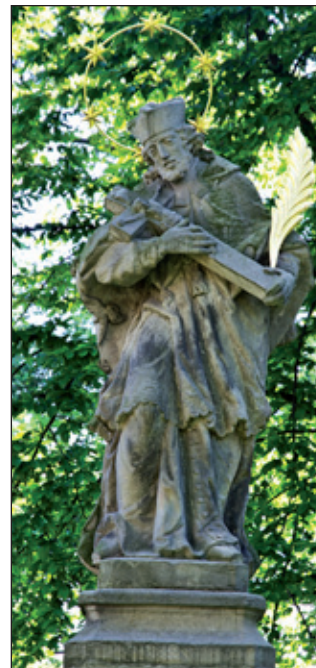
Svatý Jan Nepomucký.