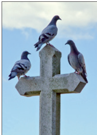
Hřbitov - snad si dušičky nevyletly na „pokec“? Pohled na střed Bohuslavic.

tivně zabráni záchytná hráz nad vesnicí, která byla nedávno vybudována. Z obce Bohuslavice je blízko hned do několika pěkných měst - Nového Města nad Metují, Dobrušky a Opocna, i do Hradce Králové je to autem cca 20 minut jízdy.