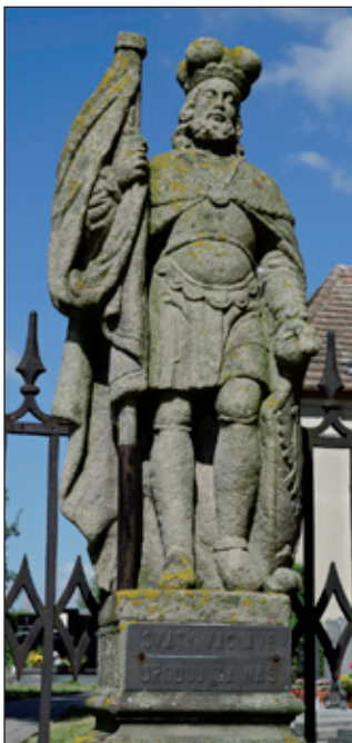
Svatý Václav u katolického kostela.