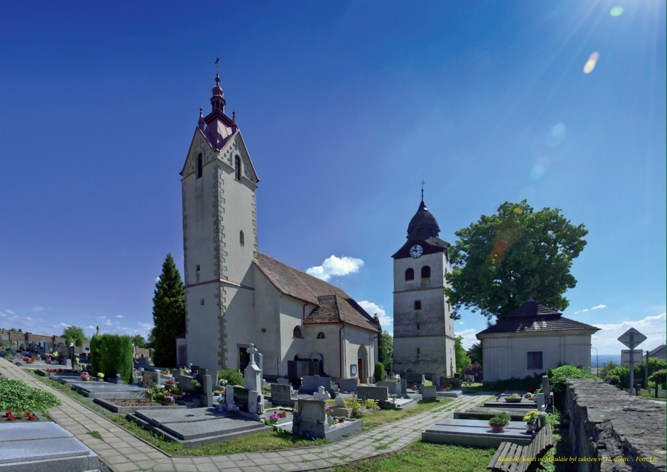
Katolický kostel sv. Mikuláše byl založen ve 13. století.