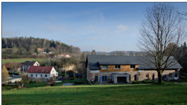
Stará architektura převáděná do užité podoby.