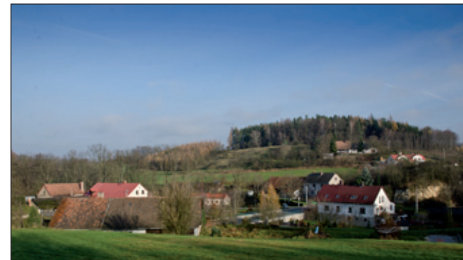
Pohled do údolí Sepského (Janovského) potoka.