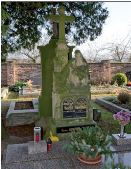
Nemohl jsem vynechat hřbitov - byl zřízen někdy na začátku 20. století. Toto je asi jeden z nejstarších hrobů.