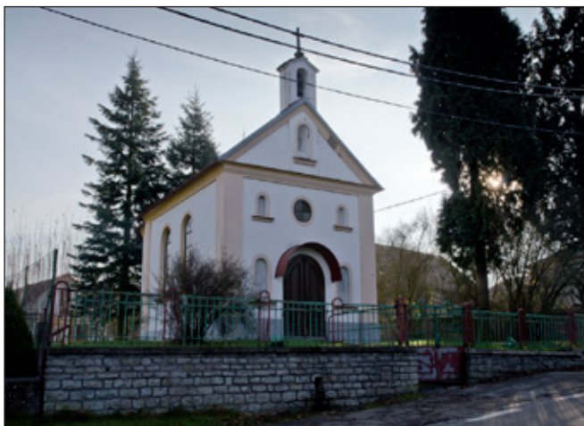
Kaple Panny Marie.