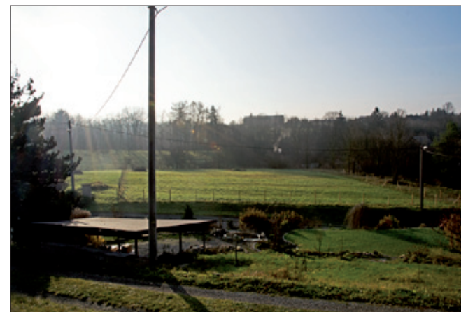
A na závěr jeden obrázek speciál:

Toto je pohled na parcelu, kvůli které vypukla celkem bouřlivá diskuse na zářijovém (2014) zastupitelstvu Nového Města nad Metují.