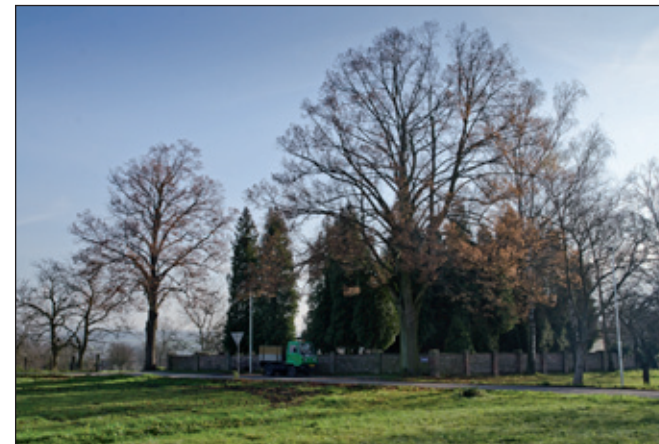
Pohled na hřbitov zvenku.