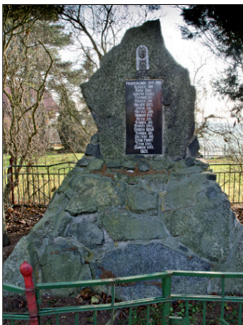
Pomník padlým z I. světové války - umístěno na návsi.