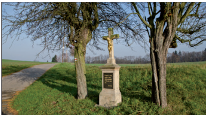
Podobné křížky jsem našel skoro na všech rozcestích okolo Spů. Tento je na odbočce k Popluží.