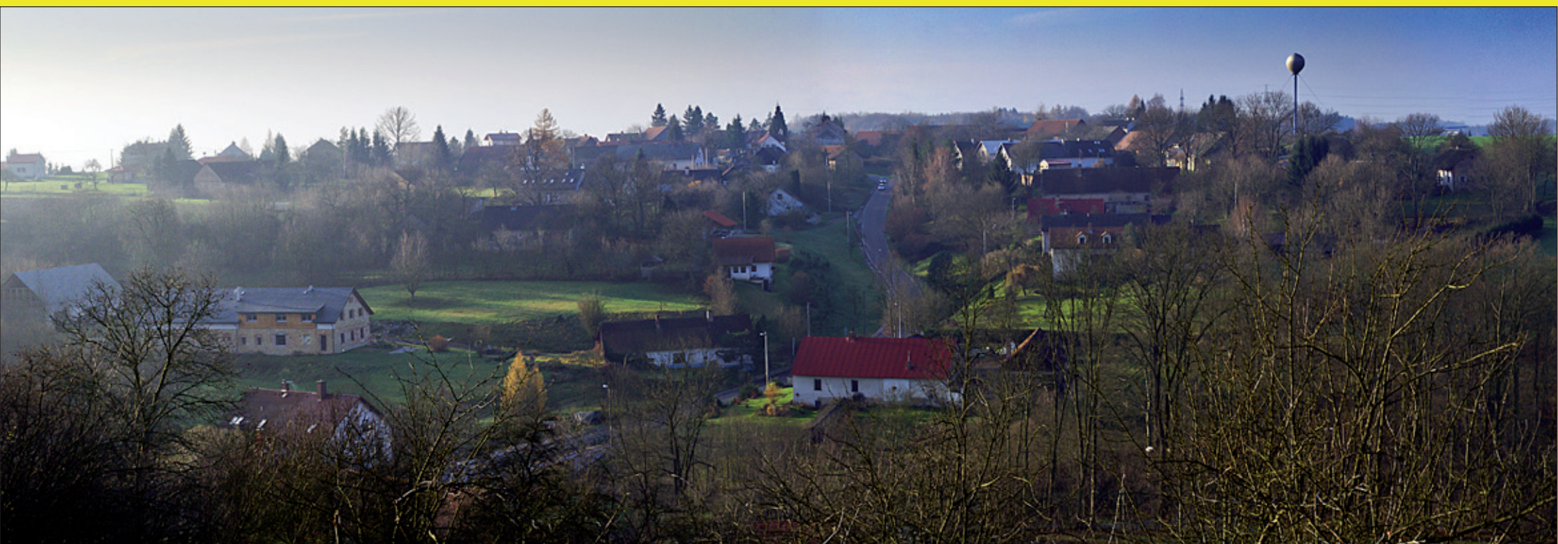
Vesnice SPY je malebně položená v údolí okolo Janovského potoka , ale rozrůstá se i do okolních rovin. Pohled na vesnici brzy po východu slunce.