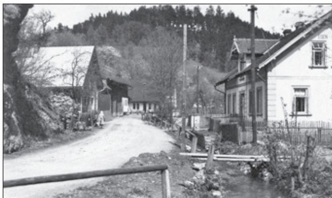
Nejstarší dřevěný most a zástavba (hodně stará fotografie). Fotografie z „Průvodce Karla Janků“ 1909. Podél silnice na Jestřebí (dnes celé zastavěné chatami).