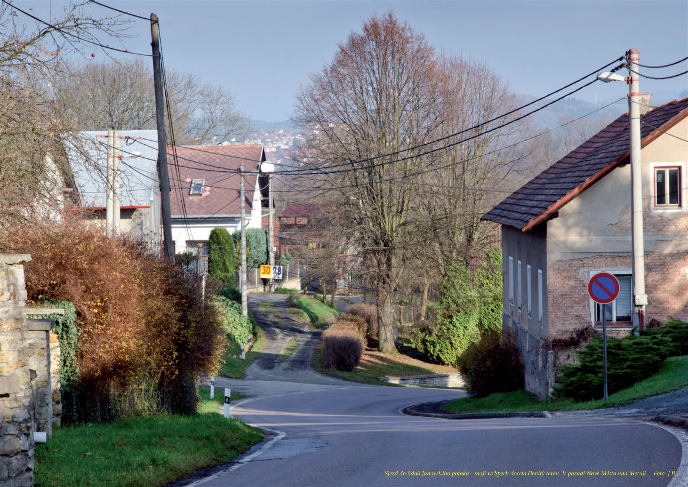
Sjezd do údolí Janovského potoka - mají ve Spech docela členitý terén. V pozadí Nové Město nad Metují.