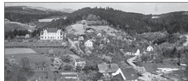
Hradčany z kostelní věže. Železný most, bagrování. Hradčany od Zázvorky.