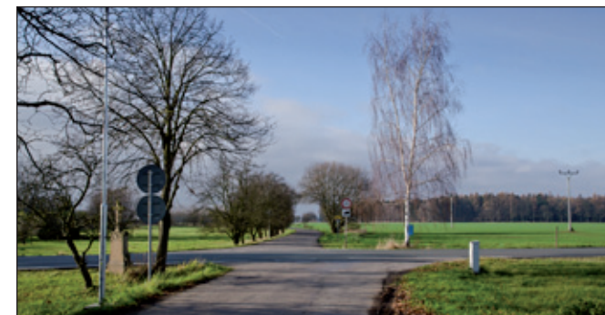
Pohled na výhledovou k Vršovce. Někud vlevo od cesty vedla zřejmě strouha, která pokračovala až k Vršovce, kde napájela Horní a Dolní rybník (?).