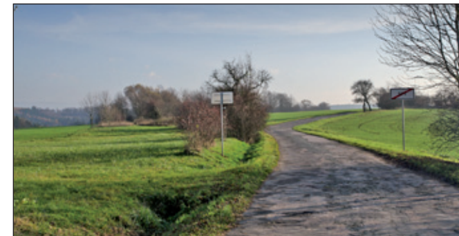
Pohled na cestu ze Spů ke Chlístovu - příkop vlevo může být pozůstatek strouhy která ke Spům přiváděla vodu od Ohnišova. Stromy vlevo v pozadí kopírují zřejmě trasu bývalé strouhy.