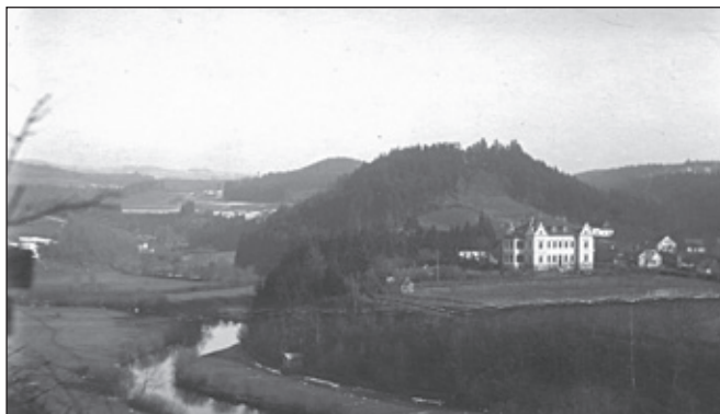
Valáškovci pod lípkou. Chaloupka na plácku u Prušínovských. Pojišťovna z Johnovy věže (dnes domek s apartmány v Rajske zahradě).