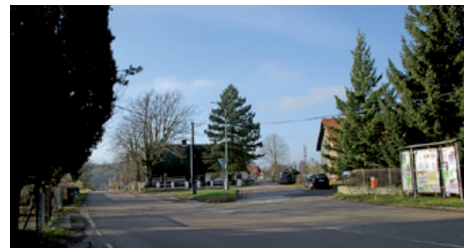
Náves a zároveň křižovatka.