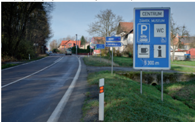
Takhle vypadá vjezd do Spů od Dobrušky - je to vlastně vjezd do Nového Města nad Metují - jen přijíždějící o tom nedostane žádnou informaci.