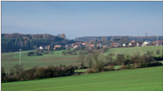
To je ta různorodost rozložení vesnice - uprostřed hluboké údolí, po stranách rovnější plochy s perspektivním užitím pro další rozvoj obce.