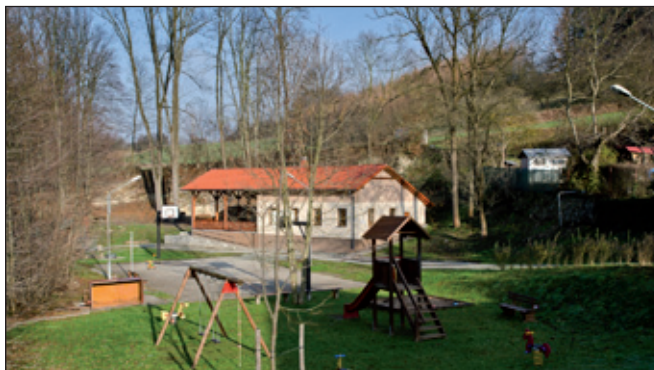
Klubovna u potoka - středisko různých srazů a zábav.