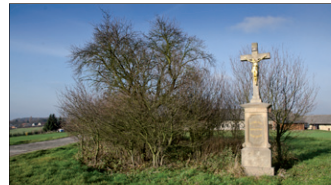
Pohled na cestu od Chlístova ke Spům, kde vpravo od cesty může být zbytek strouhy od Ohnišova. Jak jednoduché, jak geniální. Strouha potom někde přecházela vlevo od cesty a pokračovala přes Spy k Vršovce.