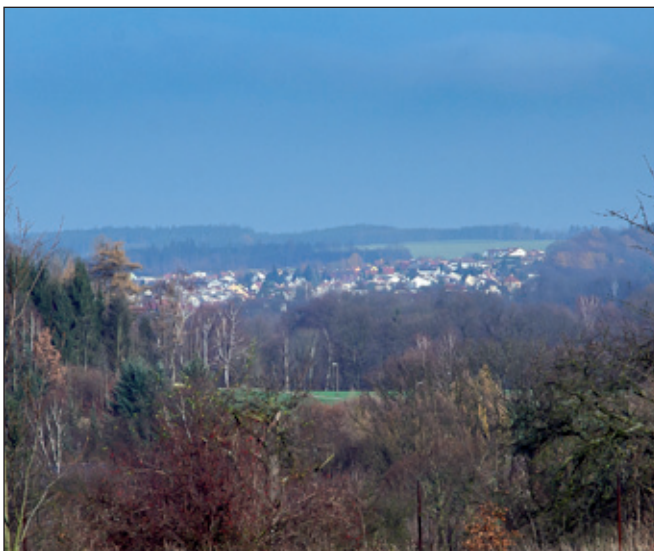
Blízkost Nového Města nad Metují je zřejmá..