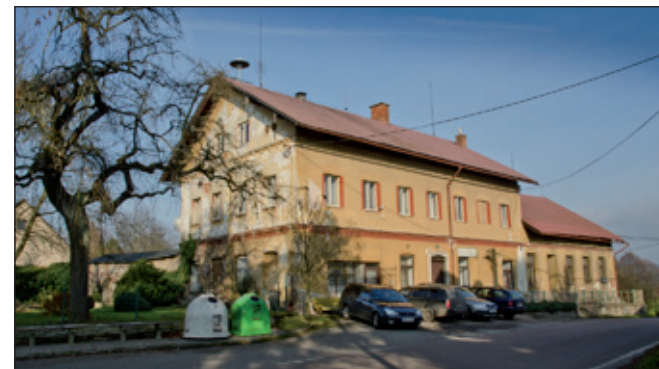
Ano, to je bývalá hospoda - škoda jí.