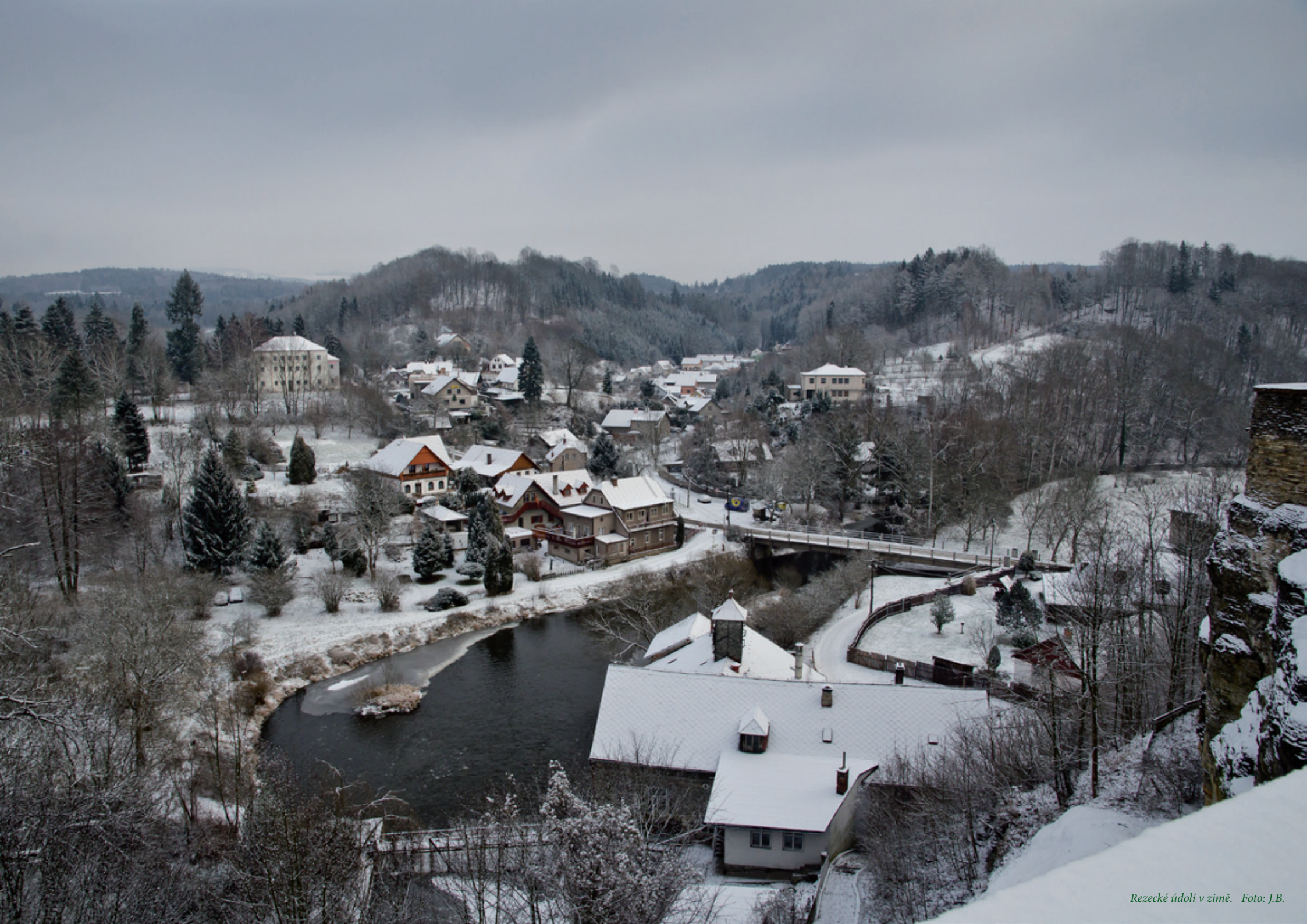
Rezeké údolí v zimě.