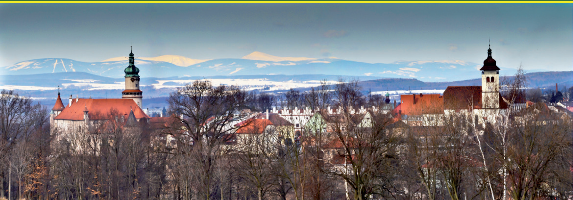
Pohled na Nové Město nad Metují z kóty 354 - to je ten kopec nad vesnicí Spy směrem k náměstí NMNM