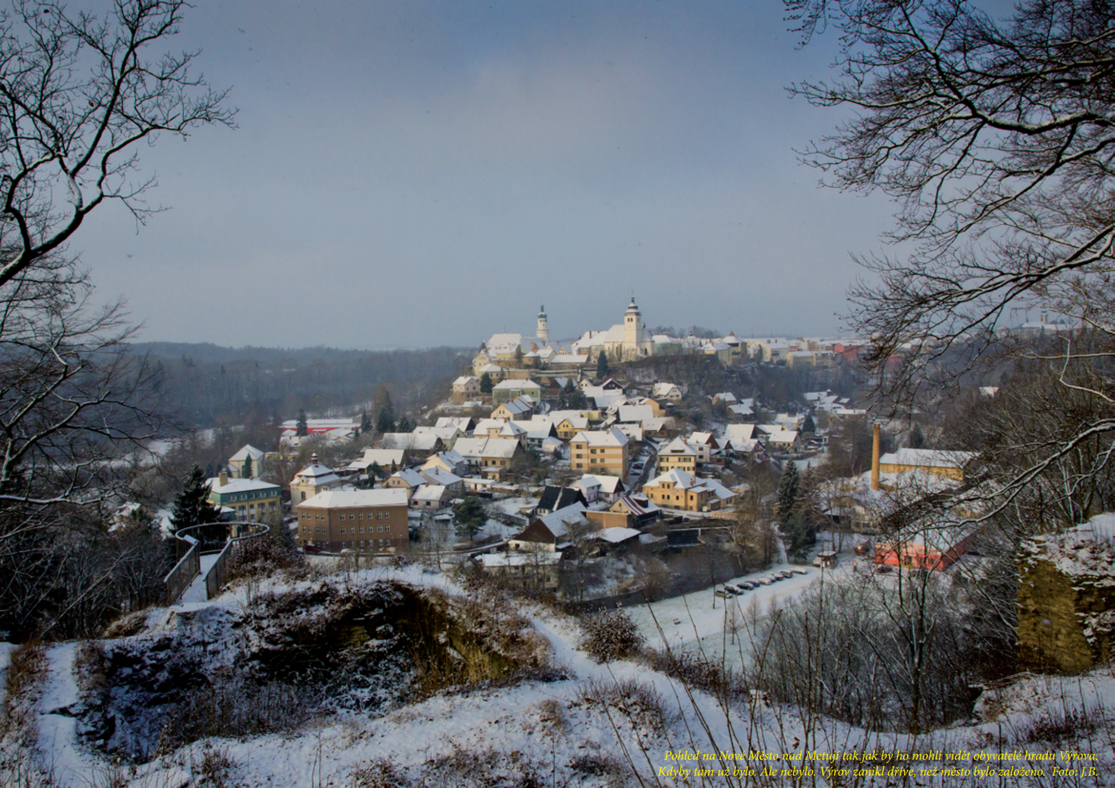
Pohled na Nové Město nad Metují tak jak by ho mohli vidět obyvatelé hradu Výrova. Kdyby tam už bylo. Ale nebylo. Výrov zanikl dříve, než město bylo založeno.