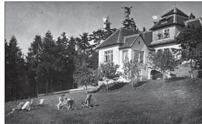
Žilíkovi v létě. Konec krásné Žilíkovy chaloupky. U mostku přes Libchyňský potok.