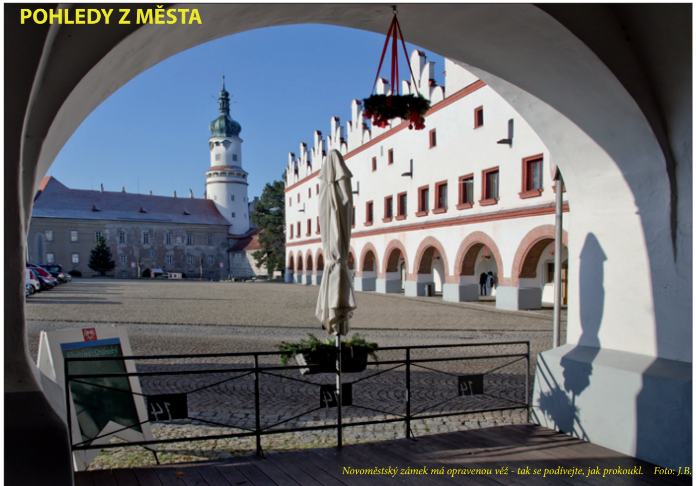
Novoměstský zámek má opravenou věž - tak se podívejte, jak prokoukl.