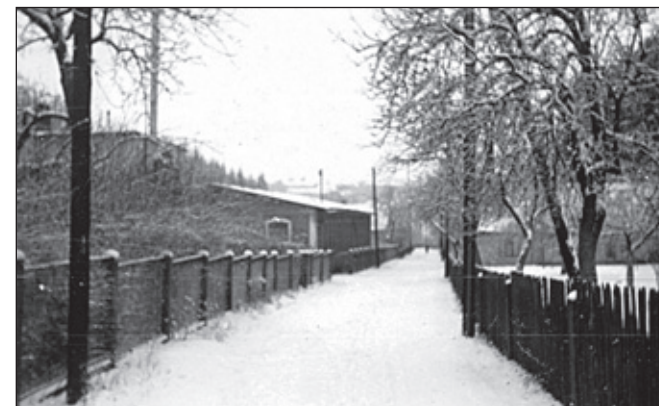
Slavíkova chalupa. Přestavba chalupy koupené Hlavsovými. Schneiderova nitárna.