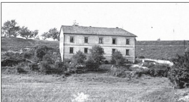
Stavba zahradnictví u elektrárny - 1960. Stavba zahradnictví u elektrárny - 1960. Andělovna u viaduktu, v popředí Železova louka.