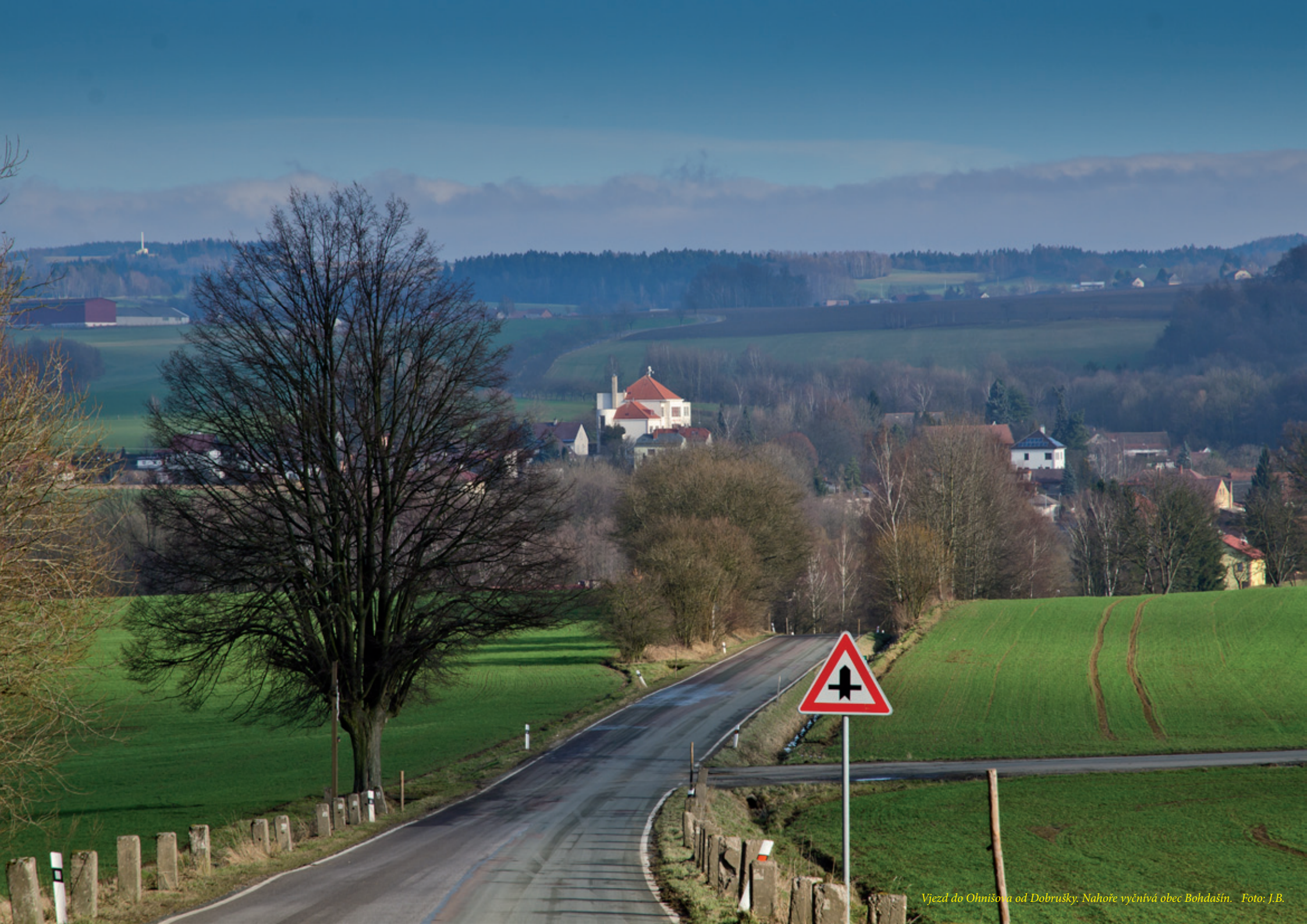
Vjezd do Ohnišova od Dobrušky. Nahore vyčnívá obec Bohdašín.