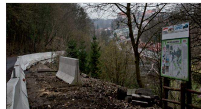
Nahore pohled z vyhlídky uprostřed Ždárského kopce. Klasika. A takhle vypadá tato vyhlídka na Ždaru - po úpravě silnice zatím trochu narušená.