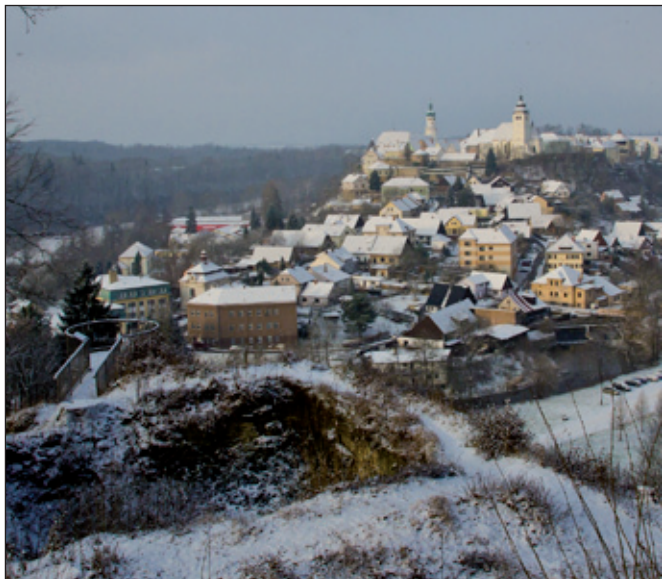
Toto je Juránkova vyhlídka na hradě Výrov a pohled z ní.

Dvořáčkova vyhlídka a pohled z ní. Trochu zaclání větve.