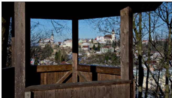
Klosova vyhlídka nedaleko sokolovny a pohled z ní.