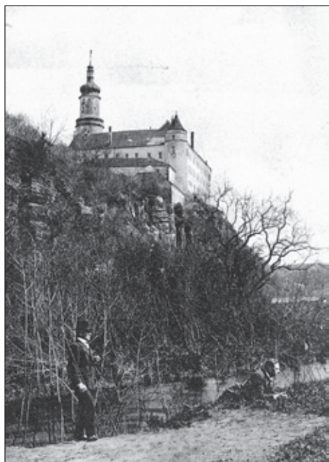
Zámecká elektrárna v roce 1909. Zámek v roce 1909.