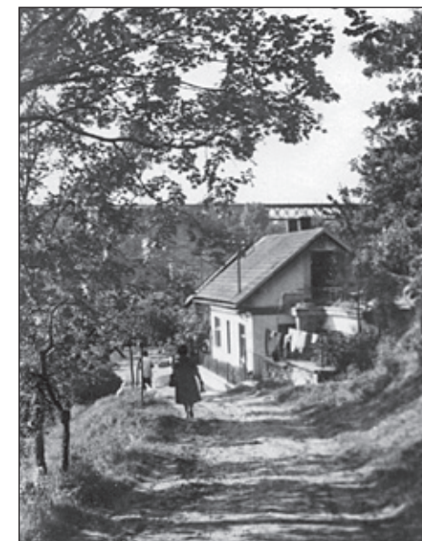
Krčínský vodočet. Před krčínským viaduktem.