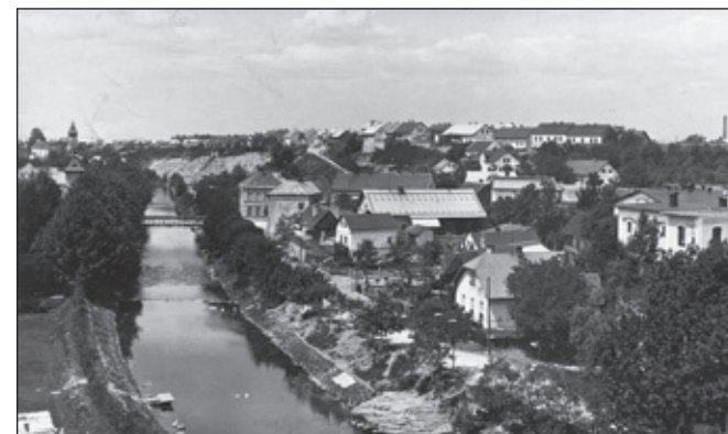
Krčín ze železničního viaduktu 1920. Krčín ze železničního viaduktu 1926. Krčín ze železničního viaduktu 1936.