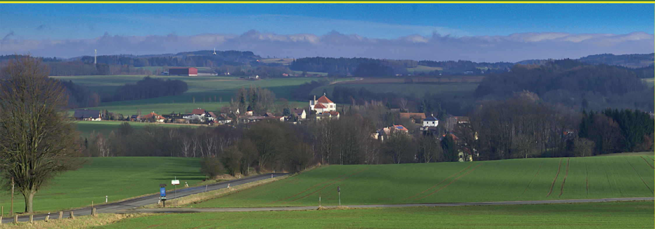
Pohled na Ohnišov ze strany příjezdu od Dobrušky. Zobrazená dominantní budova je Masarykova základní škola. Bílý sloup těsně pod horizontem je budoucí rozhledna nad Novým Hrádkem.