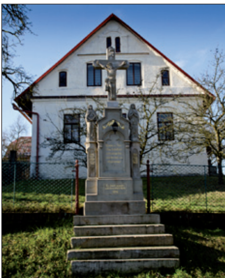
Křížek u silnice.