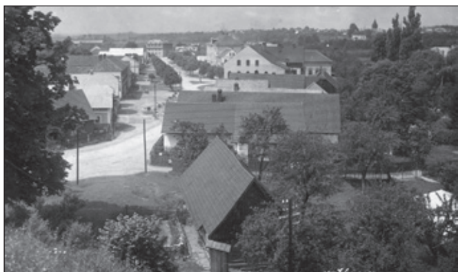
Pohled z tunelu směrem na plot „Hýblovny chalupy“. Výhled z tunelu směrem do Krčína. Pohled na Krčín z náspu železniční trati.