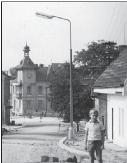
Památník hradu Budína. Pohled do ulice 1. máje směrem k mostu a bývalé krčínské radnici.