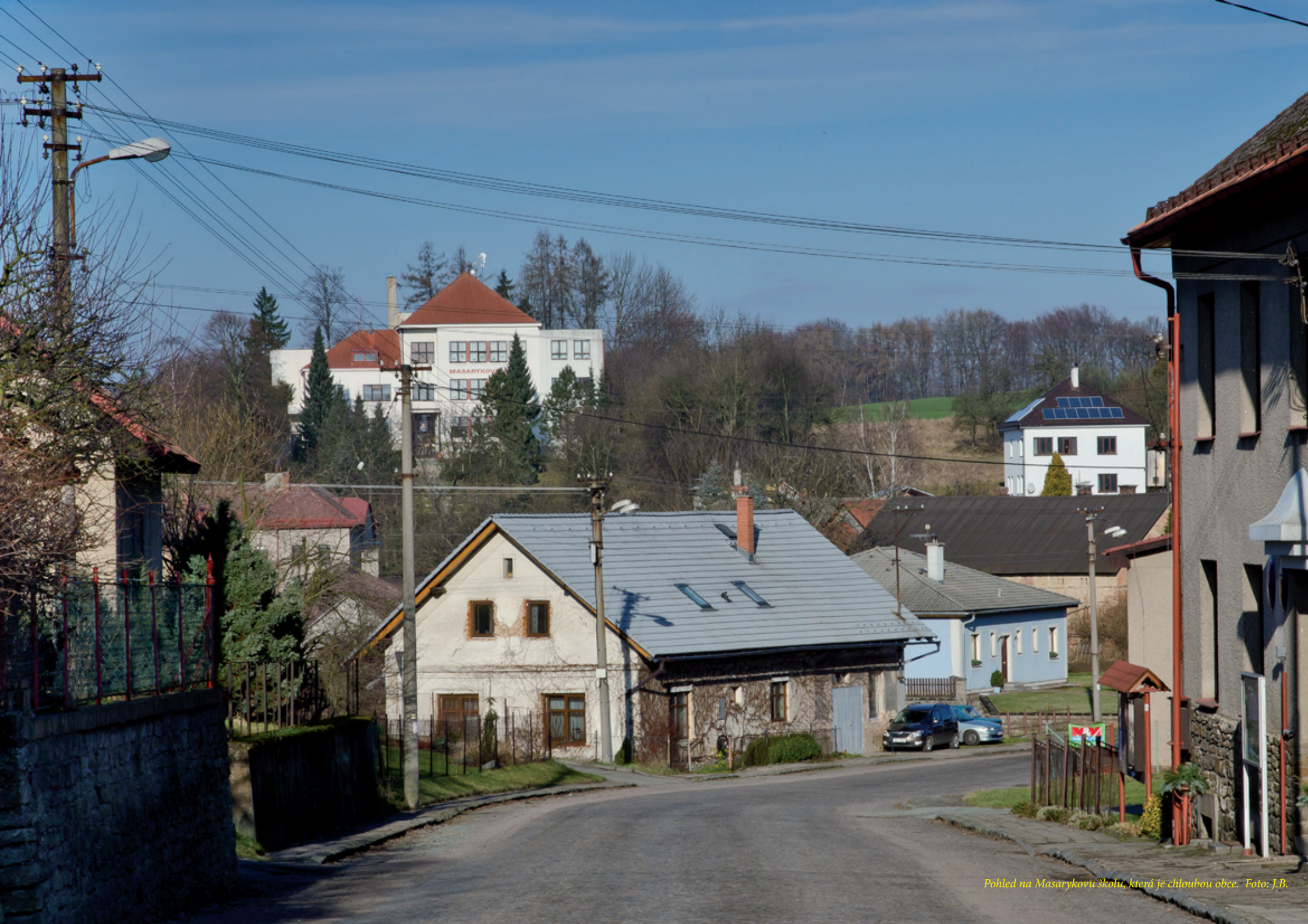
Pohled na Masarykovu školu, která je chloubou obce.