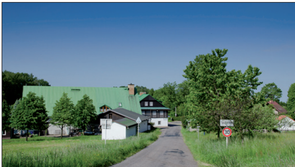
Příjezd do Sněžného „od hor“ tj. od obce Polom. Vlevo chata Horalka. Pohled přes rybníček na horním konci Sněžného.