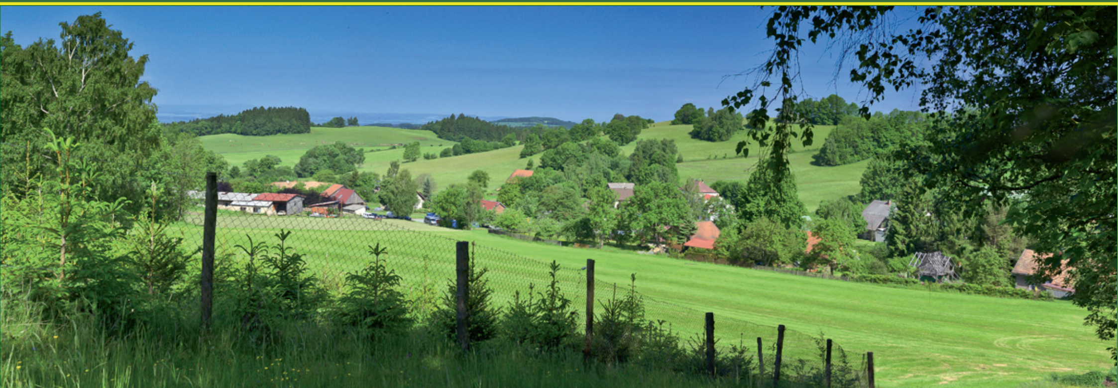
Pohled na dolní část obce Sněžné z jedné z malebných okolních strání