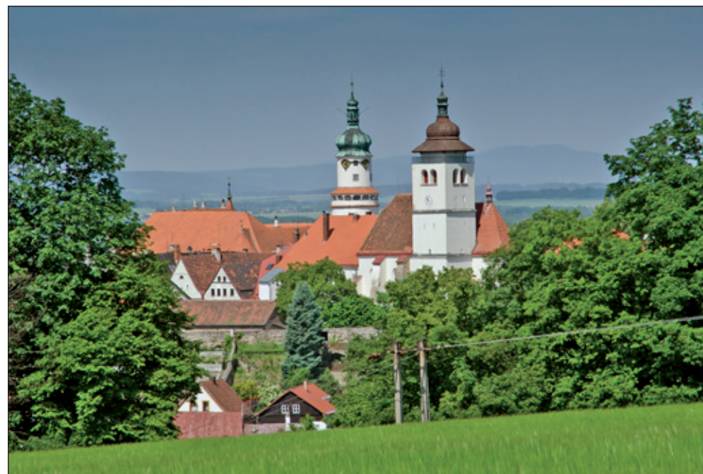
Pohled na město ze silnice nad Výrovem. Nový pohled, protože je nová zámecká věž - Máselnice. Zpevnění skal u „Zázvorky“ je dokončeno - vypadá to pěkně.