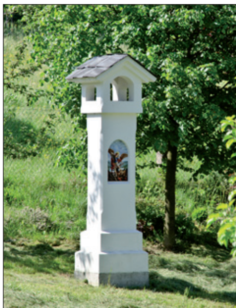
Malinká připomínka sv. Jiřího na jedné zahrádce.