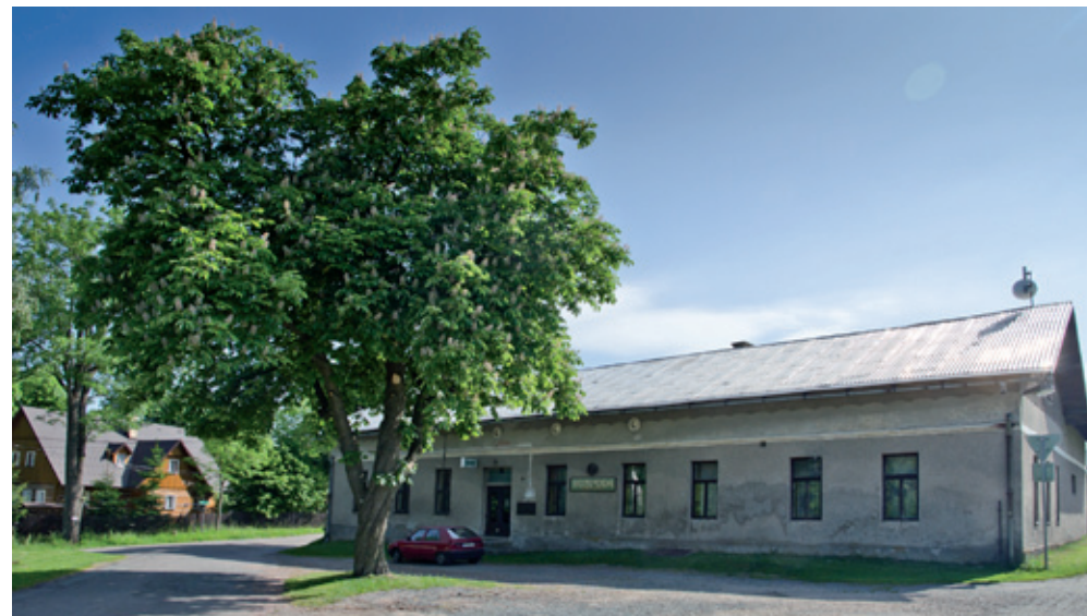
Místní hostinec na rozcestí. Na levé straně za hospodou se jede na Polom. Vpravo podle hospody do údolí Zlatého potoka Pohled k rybníčku zespodu a podél Horalky výjezd k obci Polom. Vpravo průčelí chaty Horalka.