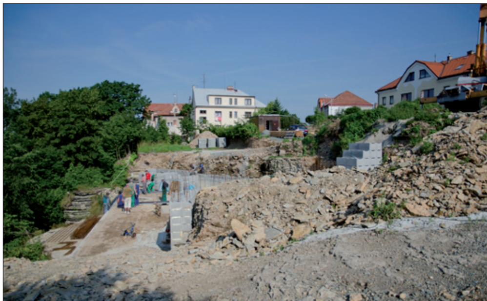
Nová výstavba „Na skalách“. Zpevnění silnice v kopci pod náměstím - směr do hor a do Spů. „Metuje“ se na to dívá. Regulace dopravy semaforem. Dobrá práce.