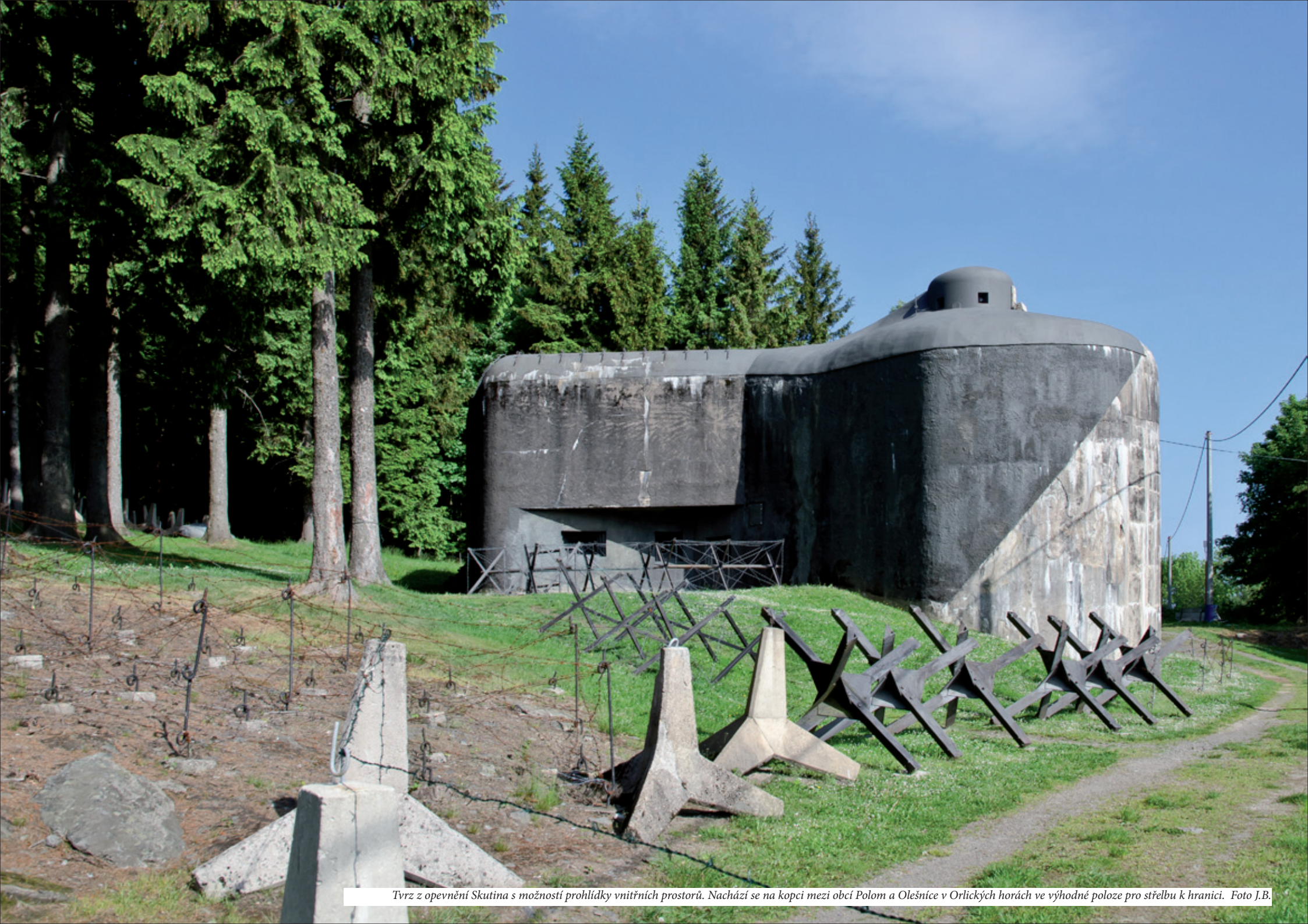
Tvrz z opevnění Skutina s možností prohlídky vnitřních prostorů. Nachází se na kopci mezi obcí Polom a Olešnice v Orlických horách ve výhodné poloze pro střelbu k hranici.