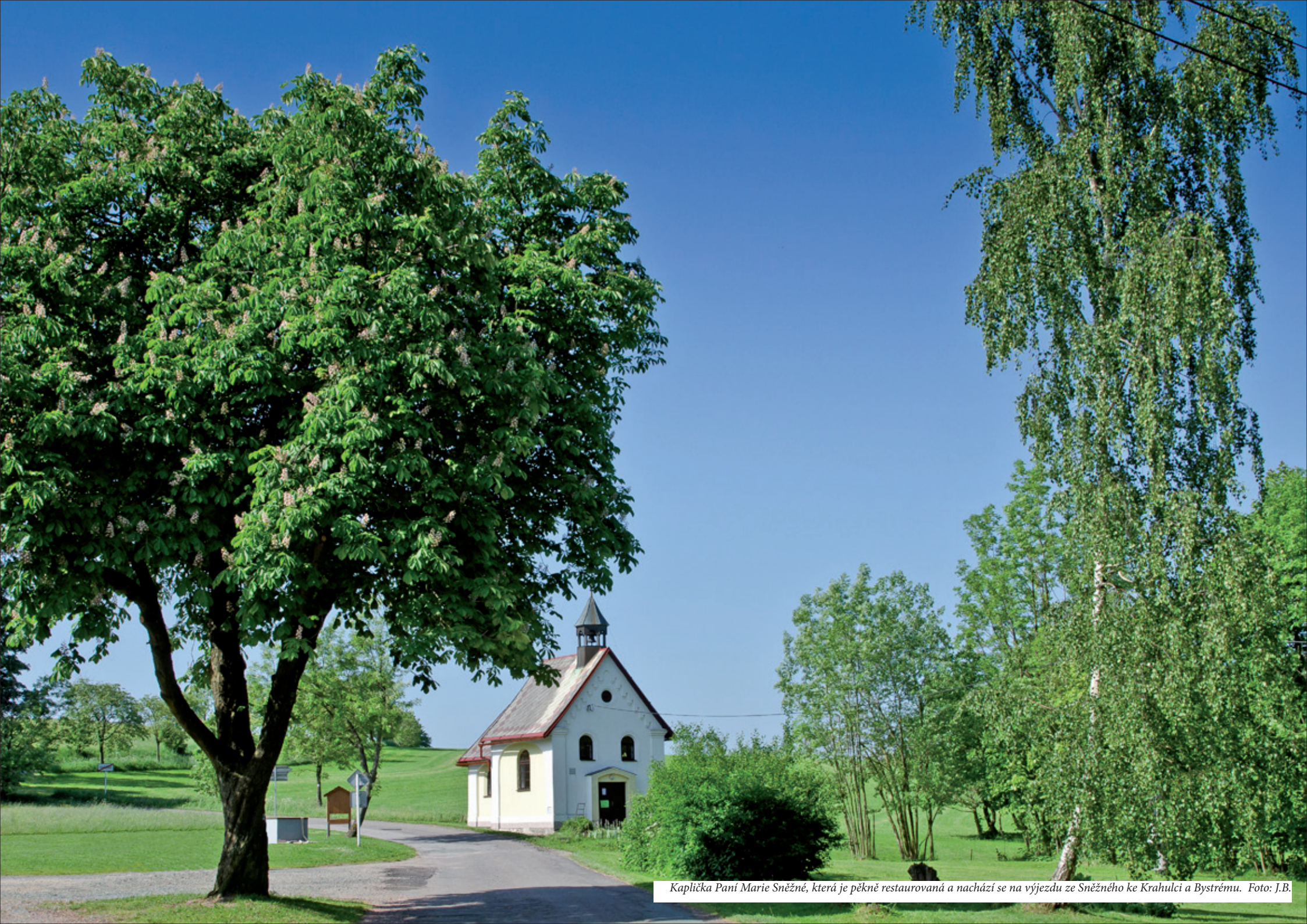
Kaplička Paní Marie Sněžné, která je pěkně restaurovaná a nachází se na výjezdu ze Sněžného ke Krahulci a Bystrému.