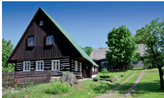
Chalupa. Chalupa. Chalupa.