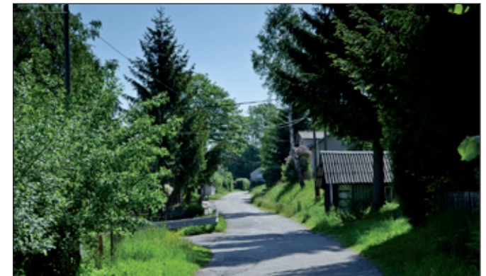
Další rybníček uprostřed vesnice. Malebné zákoutí u jedné z chalup. Průjezd vesnicí nahoru k hospodě.