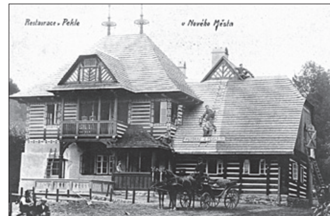
Peklo 1909. Peklo před přestavbou 1908. Přestavba dle Jurkoviče.