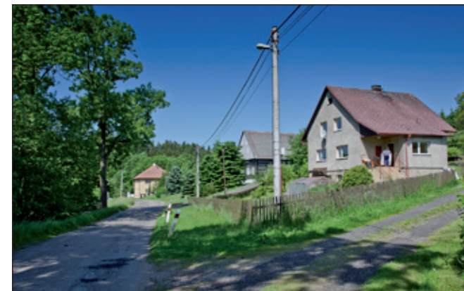
Jeden ze starších statků ve vesnici. Co chtít více: potůček, můstek, posečená loučka a chaloupka jako malovaná. Výjezd ze Sněžného směrem na „olešnickou“ silnici.