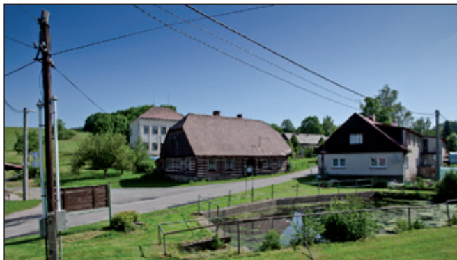
Další rybníček uprostřed obce.