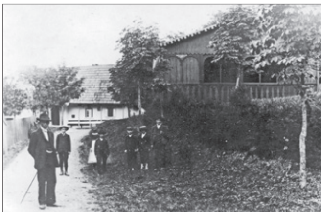
Starý mlýn na Metuji v Pekle a Zjevení. Peklo před přestavbou 1900. Peklo před přestavbou 1900.