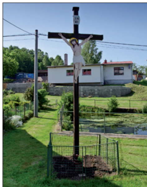
Boží muka u autobusové zastávky.