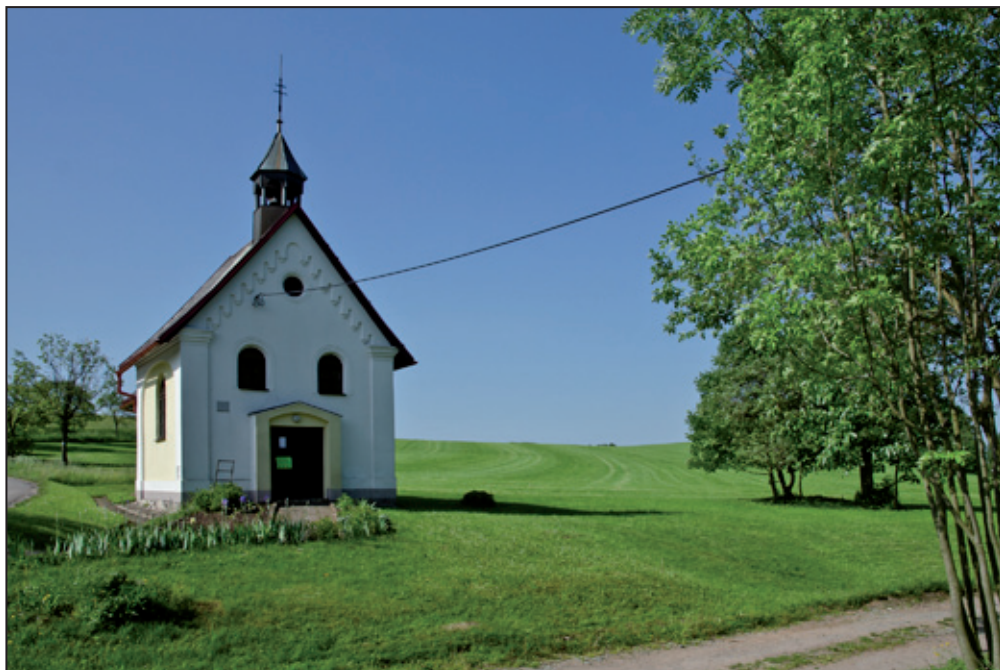
Kaplička Panny Marie Sněžné - vlevo je výjezd na Bystré. Chata Horalka - pohled do dvora.