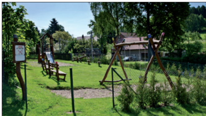
Zařízení pro děti u Obecního úřadu.