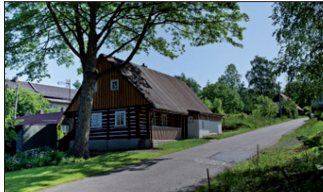
Sjezd do Sněžného od hospody - všude samá zeleň.