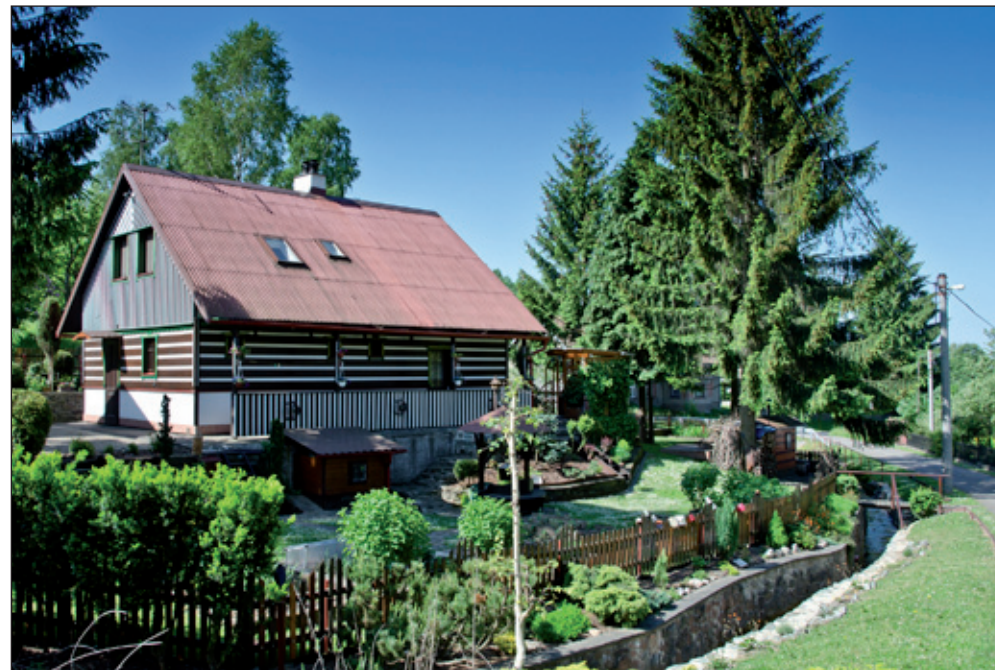
Jedna z perfektně upravených chalup. V popředí pěkně regulovaný potok Skutina. Obecní úřad s Hasičskou zbrojnicí.