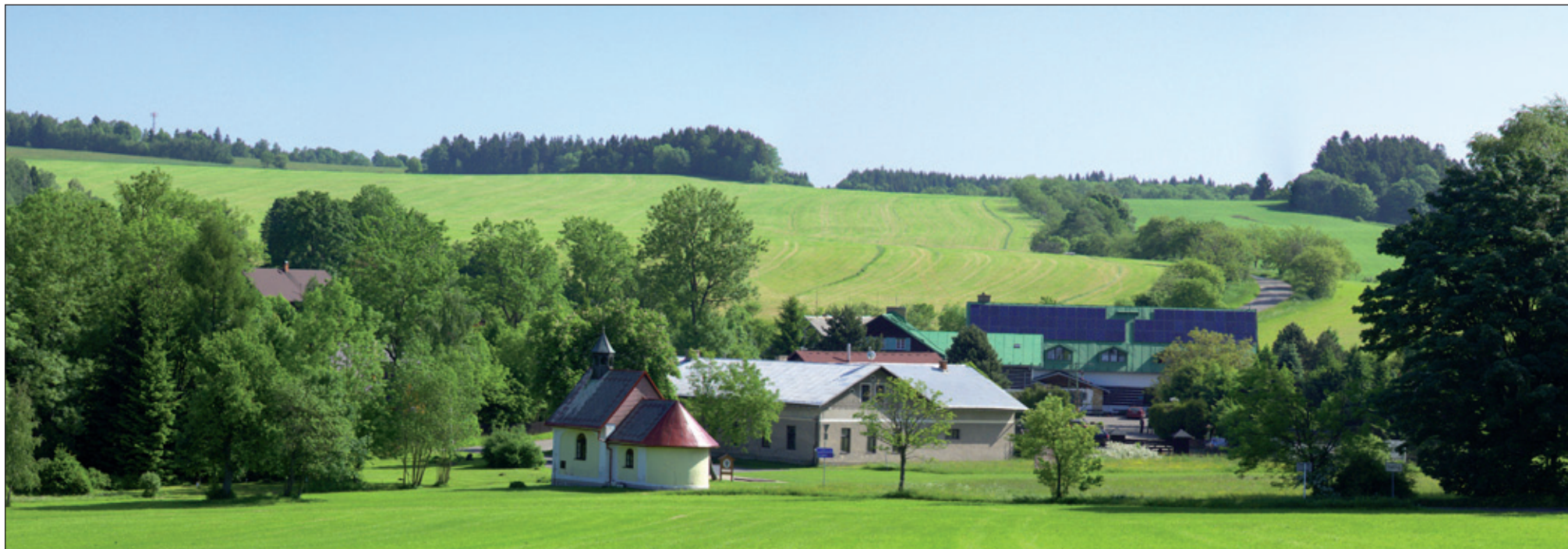
Pohled na horní část obce Sněžné - kaple Paní Marie Sněžné, hostinec a za ním komplex chaty Horalka.