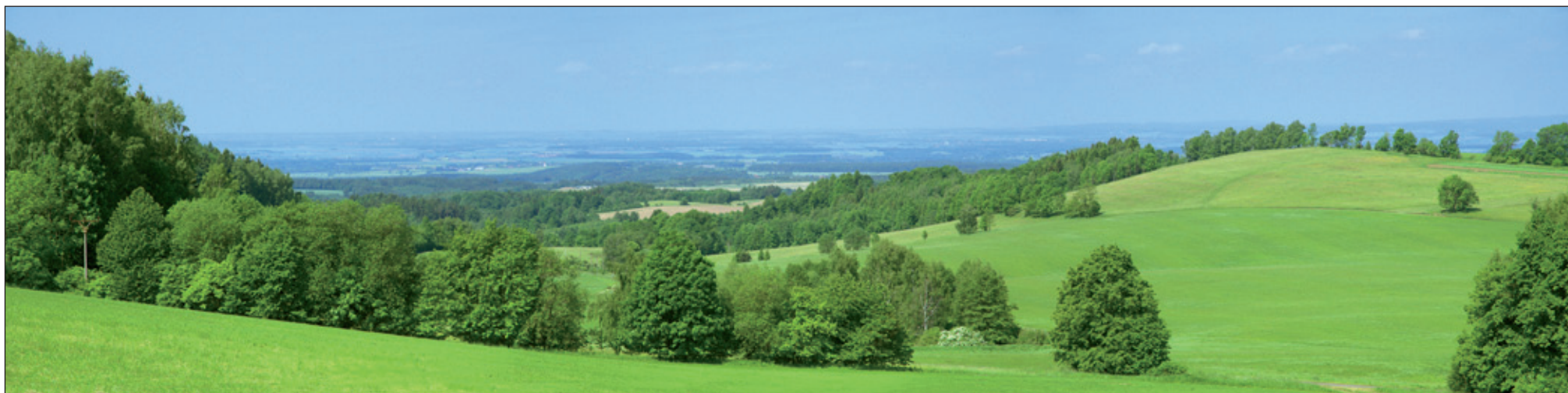
Okolo celého Sněžného jsou překrásné stráně s horskými loukami. Otevírá se pohled daleko do kraje.