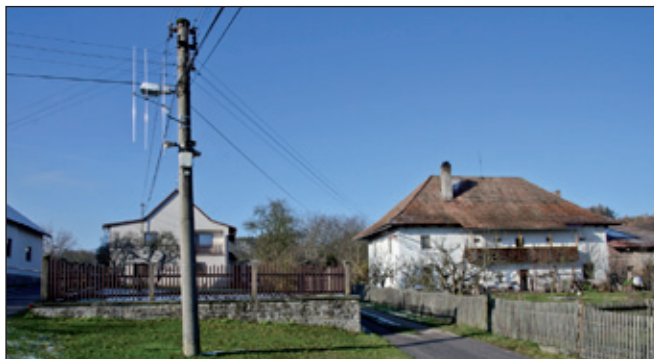
FOTO Z BĚSTVIN