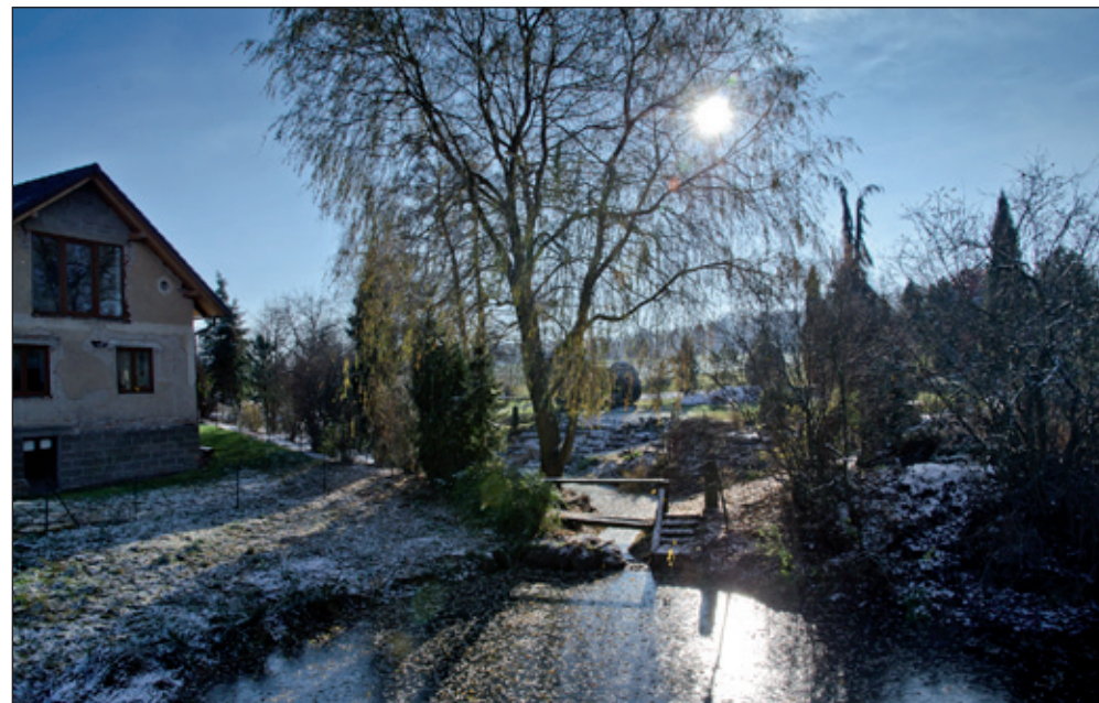
Rybniček uprostřed vesnice. Pohled na hlavní třídu v Běštvínách.