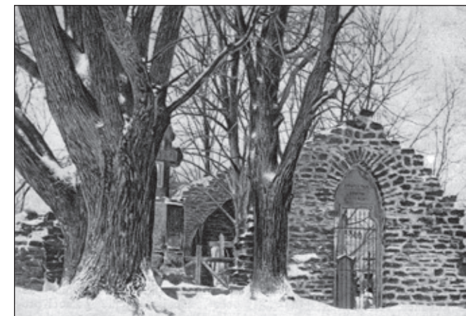
Náchod. Vojenský hrbitůvek z r. 1866.

Dlouho potom nebylo o tlupách prušáckých ničeho slyšeti, až tu k večeru dne 1. srpna 1866 rozezvučí se zvon na naší věži