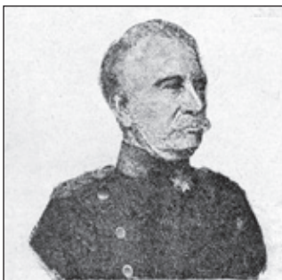
Generál pěchoty Karel ze Stelnmetzu, velitel V. prus sboru arm.

Prusáci naučili se též po česku nadávati „české potvory“ a jeden pruský lékař prohlásil, že by všickni Češi měli býti pověšeni.