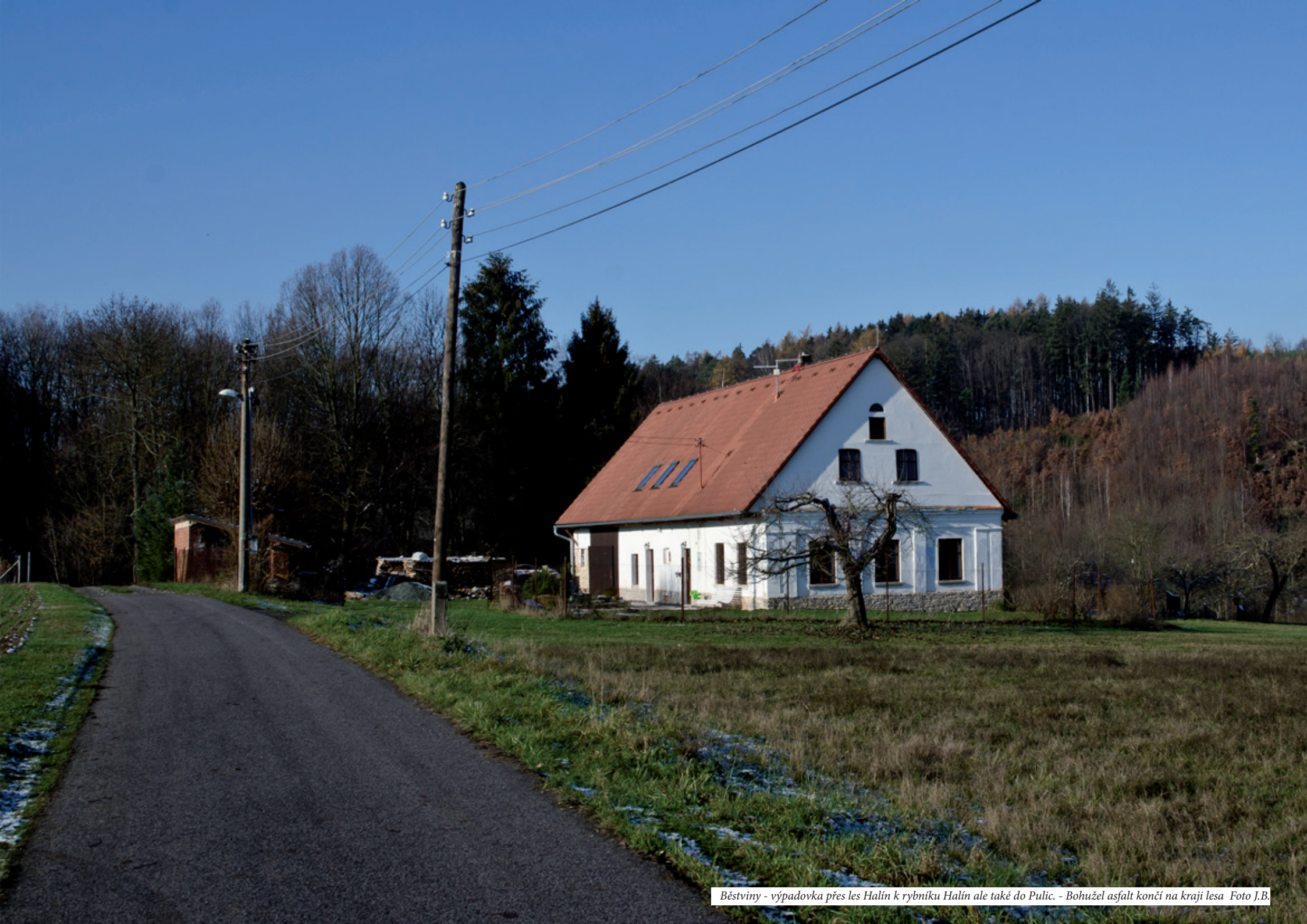
Běstviný - výpadovka přes les Halín k rybníku Halín ale také do Pulic. - Bohužel asfalt končí na kraji lesa