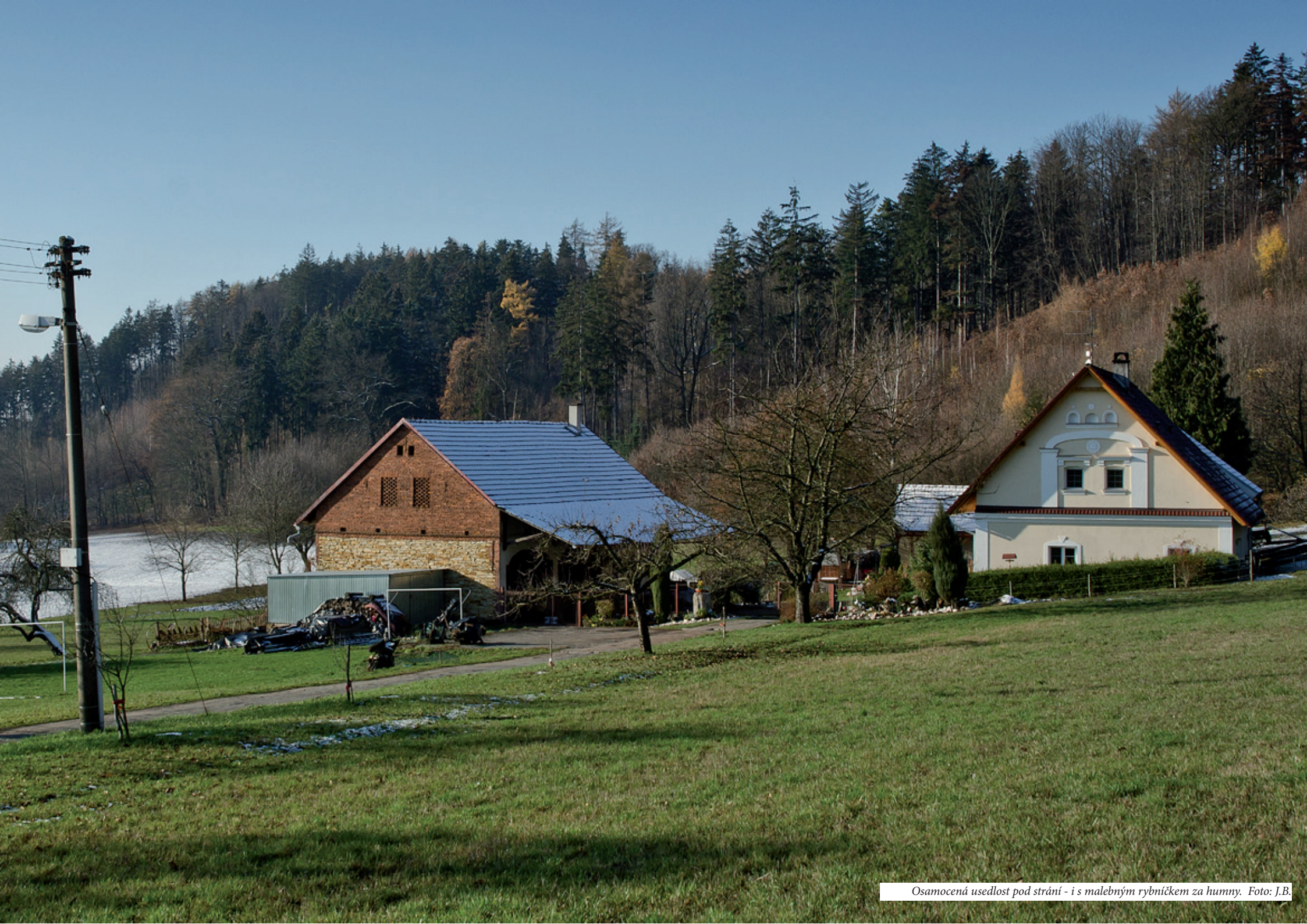
Osamocená usedlost pod strání - i s malebným rybníčkem za humny.