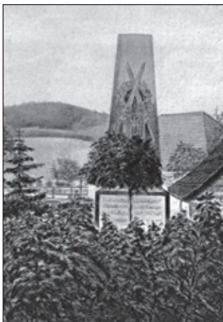
Pomník prvního padlého — desátníka Fr. Součka u běloveské celnice.

ků i koní, převržené vozy, odhozené pušky, zlomené píky i meče ležely na polích i cestách a čím více blížili jsme se k Václavicům, tím strašnější byl pohled.