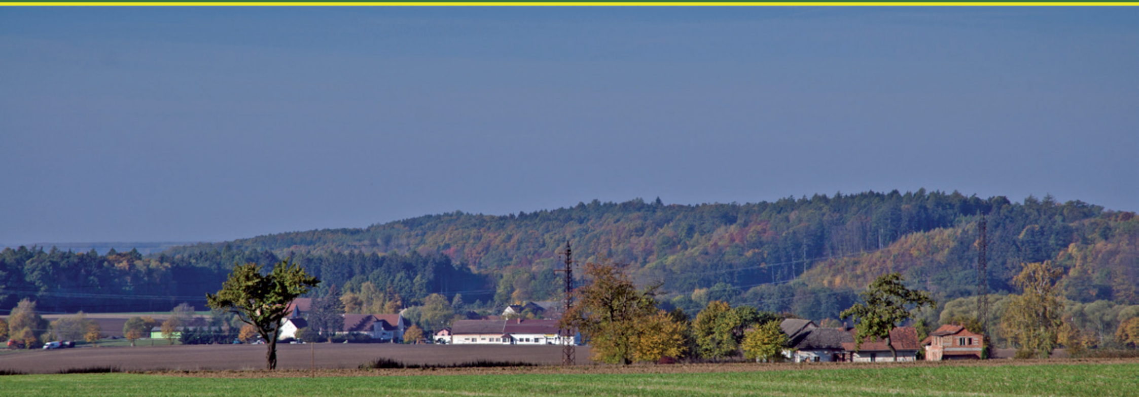
Pohled na Běstvinu od Chlístova...