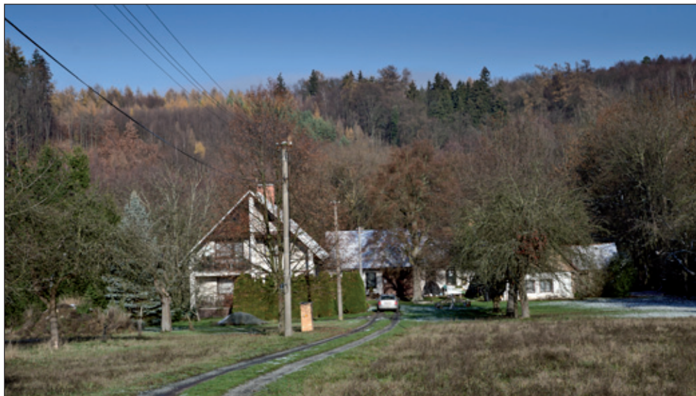
Pěkná usedlost pod cestou do Halína. Jistě starobylý dům ve vesnici.