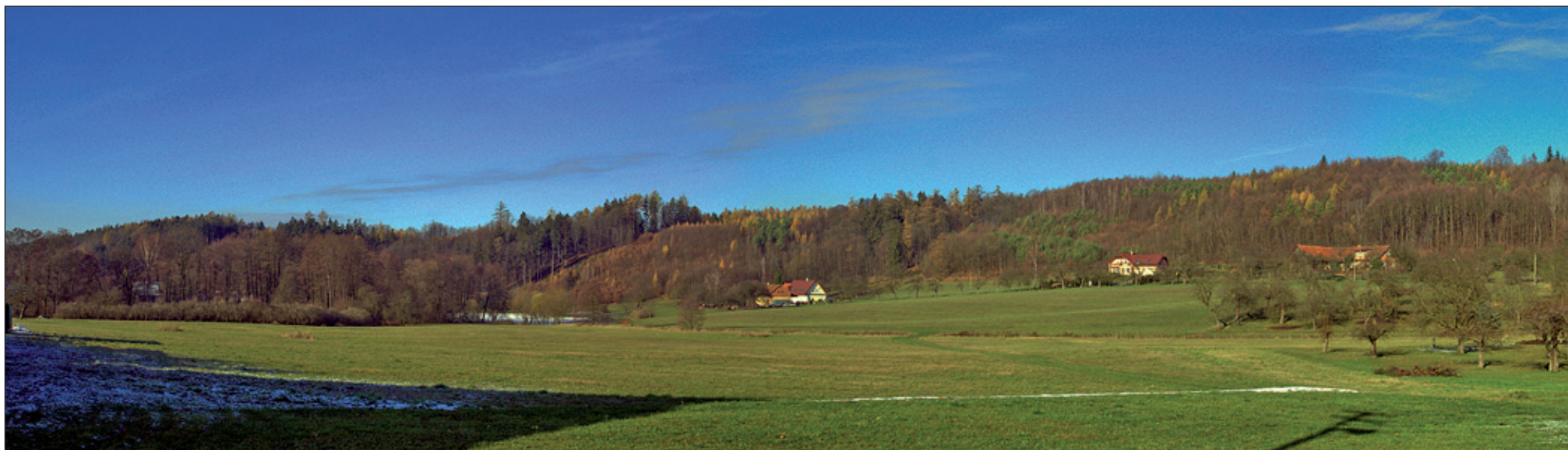
Louky a domky roztroušené pod strání, pěkně s pohledem na jih. Běstvíny - střed vesnice.