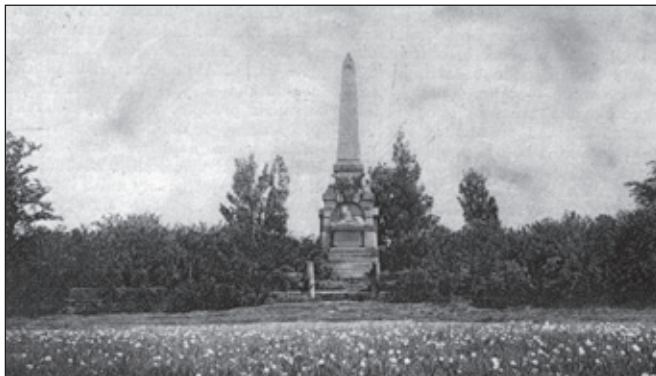
Jezdecký obelisk u Vysokova.