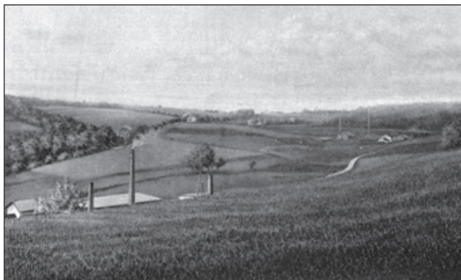
Pohled na bojiště „Na Brance“ ze Šibeničního vrchu.

Proto povstal náš lid k obraně. Jednotlivci ozbrojovali se, čím se dalo (tenkrát o pušku nebo šavli nebylo nouze),