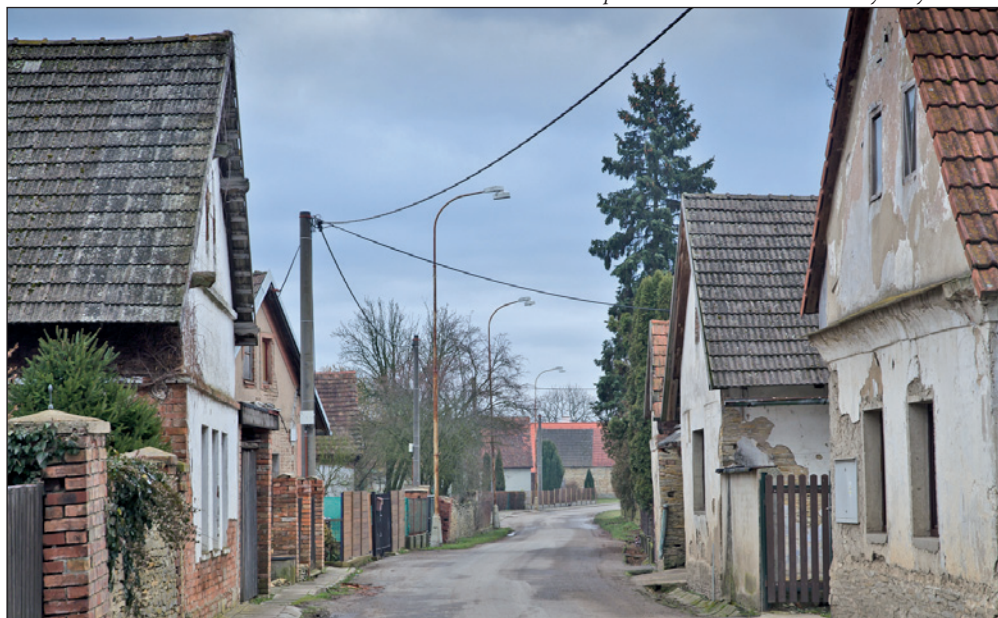
A tady jsme zpátky v Českém Meziříčí - vjezd do obce od Jaroměře. Vidíte ten provoz?