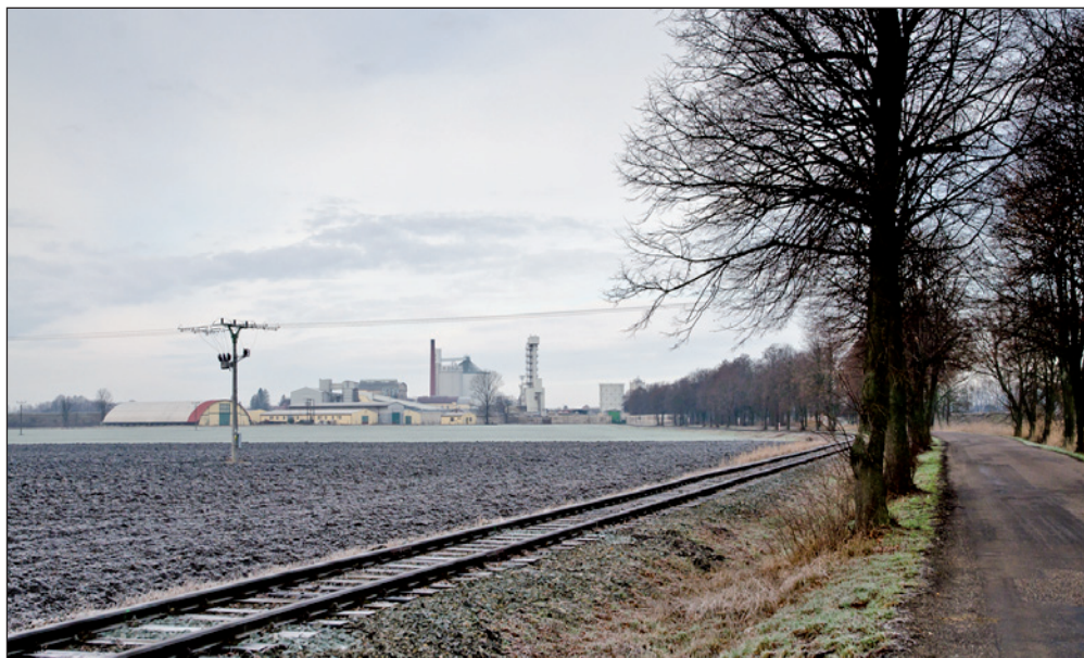
Takhle vypadá příjezd do Českého Meziříčí od Pohoří - přiznám se, že jsem tudy jel poprvé.

A toto je ten „legendární“ potok, který mění své jméno a všimněte si, kudy všude teče. Zde před Českým Meziříčím.