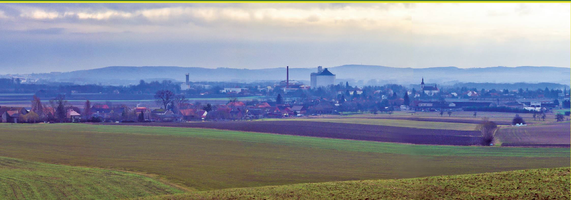
Pohled na Českou Meziříčí od severu - s tzv. „Bílého kopce“ nad Rohenicemi. Bohužel počasí mi tentokrát moc nepřálo.