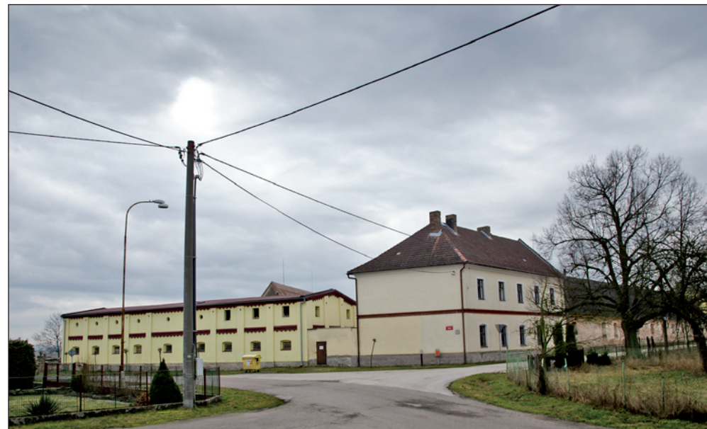
Skršice - Tošov.