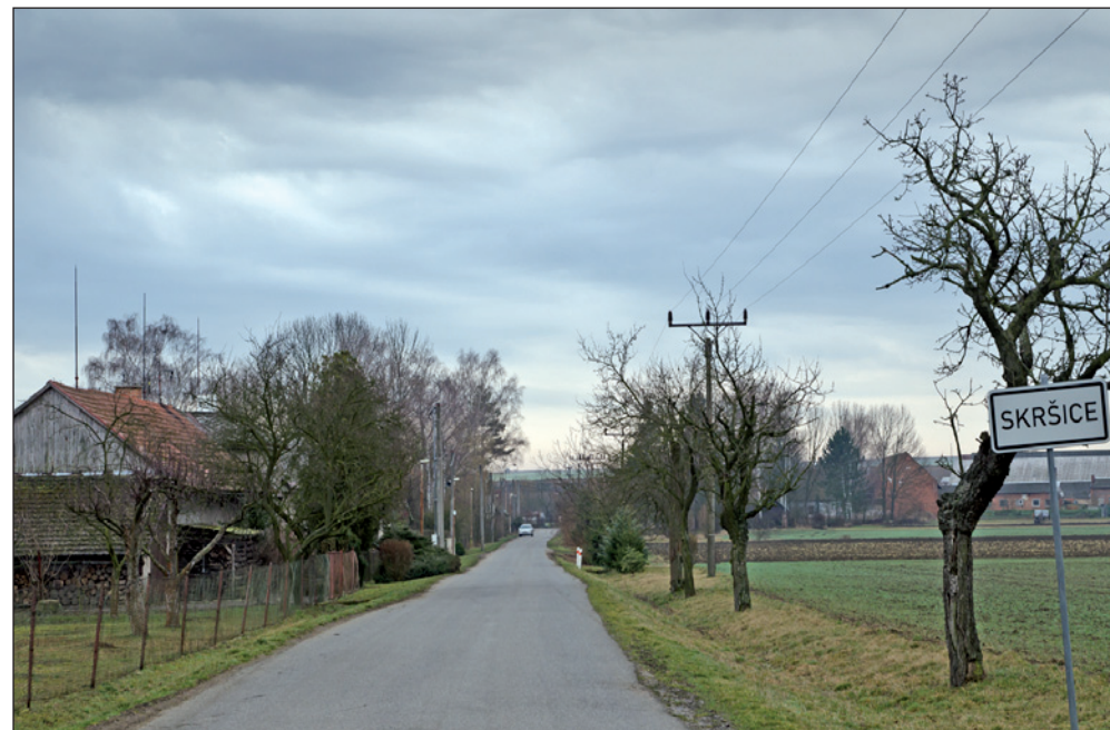
Skršice - vjezd do vesnice od Královy Lhoty.