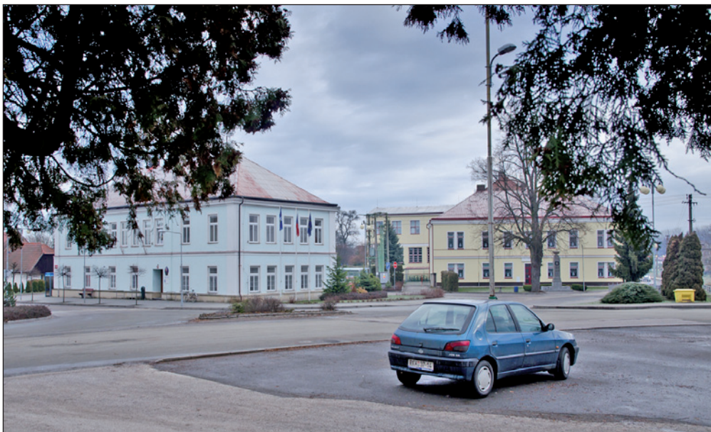
Centrum Českého Meziříčí od kostela.