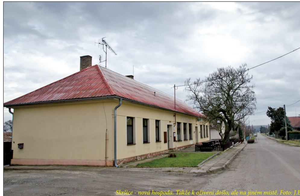
Skršice - nová hospoda. Takže k oživení došlo, ale na jiném místě.