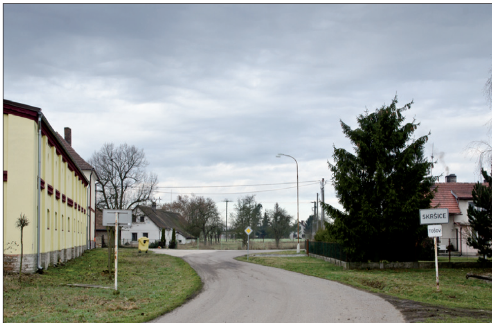
Skršice - Tošov - vjezd do vesnice od Českého Meziříčí.