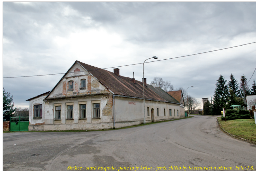
Skršice - stará hospoda, pane to je krása - jenže chtělo by to renovaci a oživení.