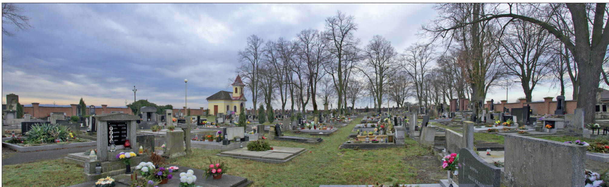
Rozlehlý hřbitov v Českém Meziříčí.