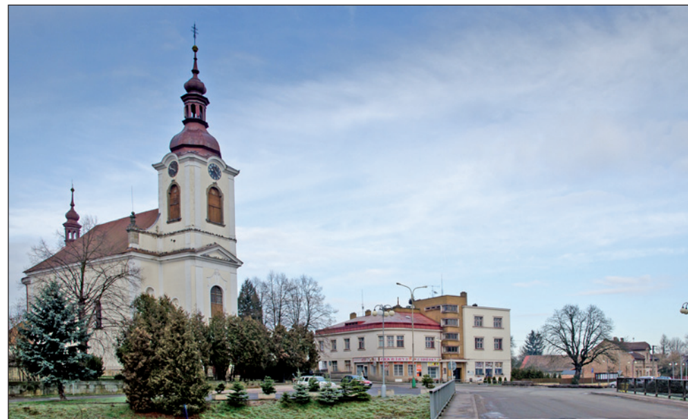
Kostel sv. Kateřiny..

Opravdu pěkná škola. Věřili byste, že je už 81 let stará? Podívejte se na www stránky obce , o škole je tam řada informací