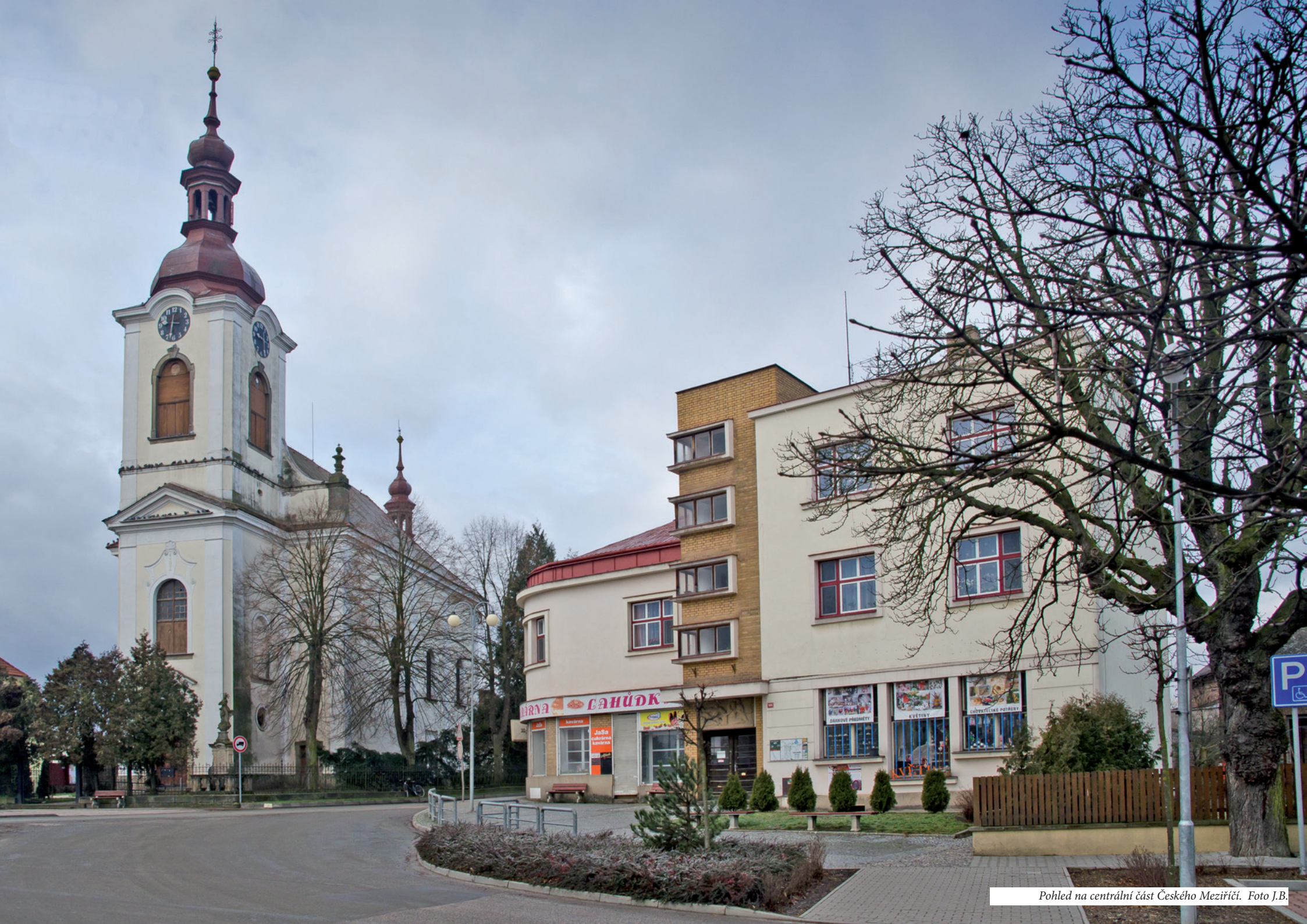
Pohled na centrální část Českého Mezirčiči.