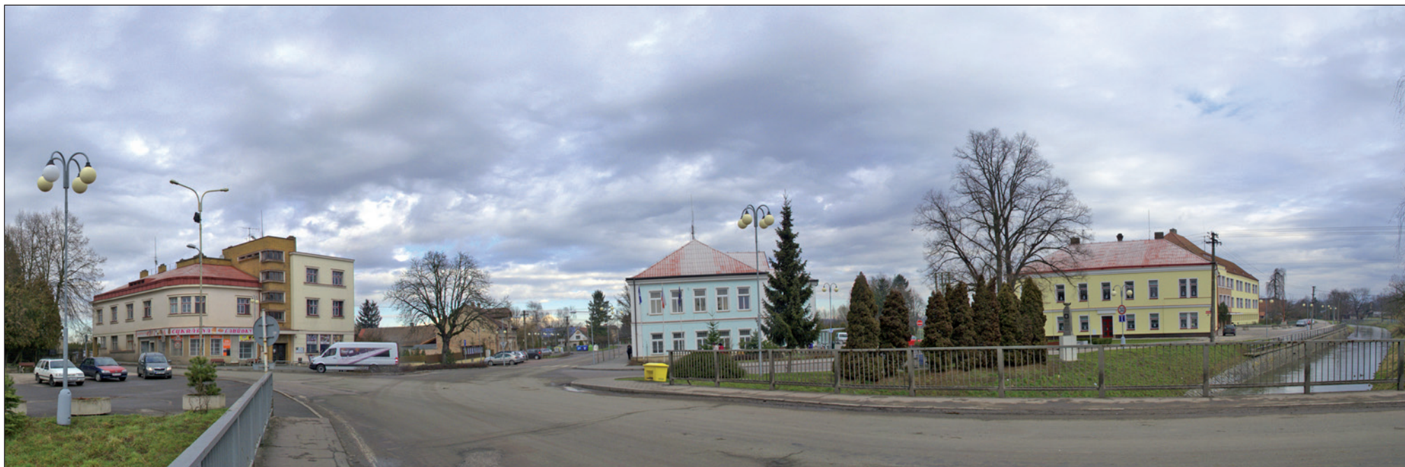
Pohled na centrum Českého Meziříčí.