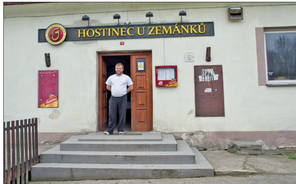
Pan hospodský má dobrou náladu, nabídka jídel a pití je samozřejmostí.