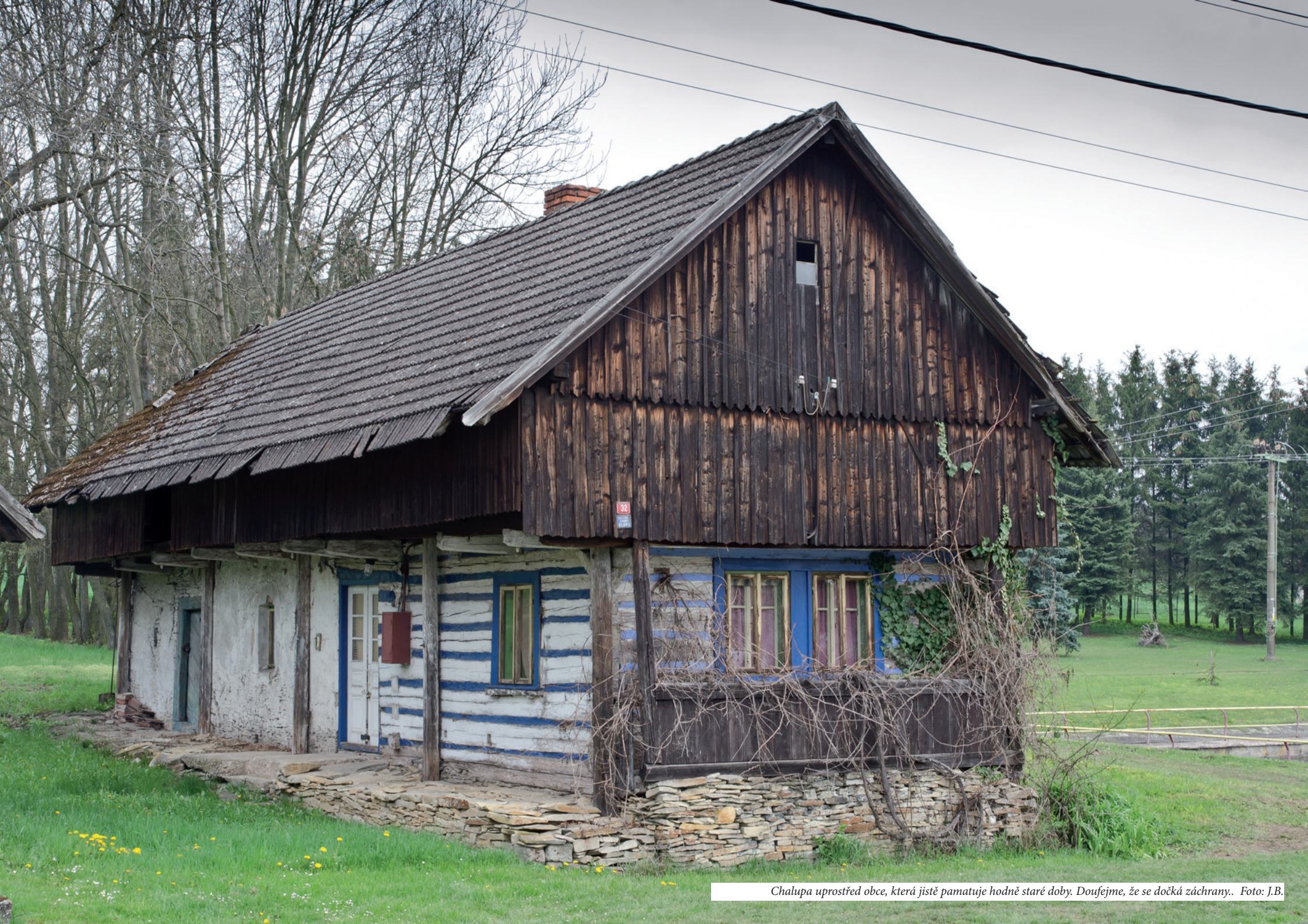
Chalupa uprostřed obce, která jistě pamatuje hodně staré doby. Doufejme, že se dočká záchrany.