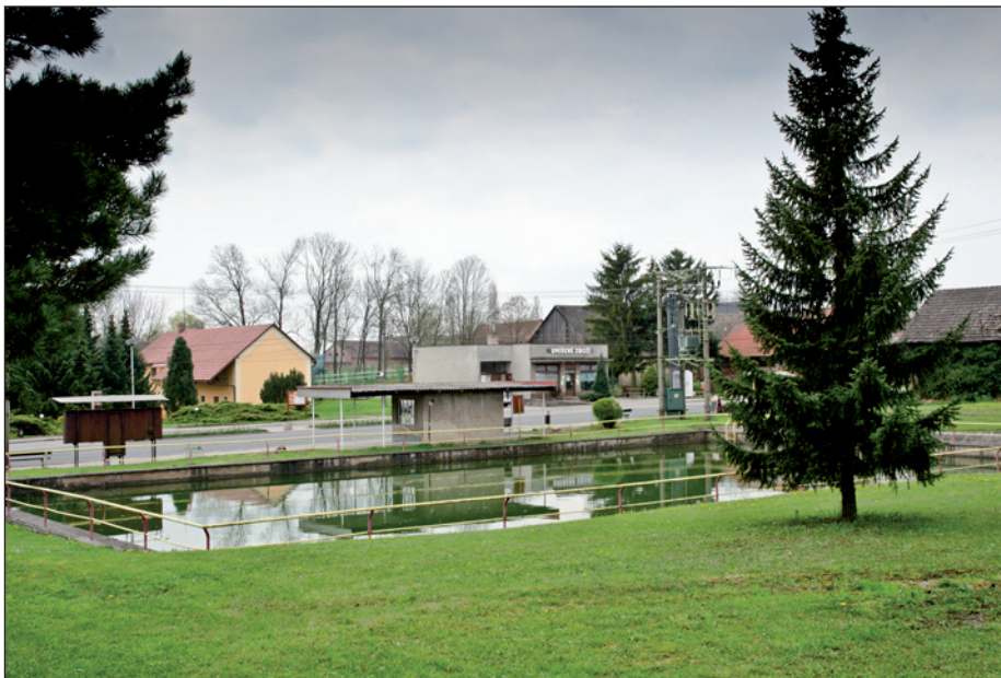
Pohled přes požární nádrž ve středu obce..