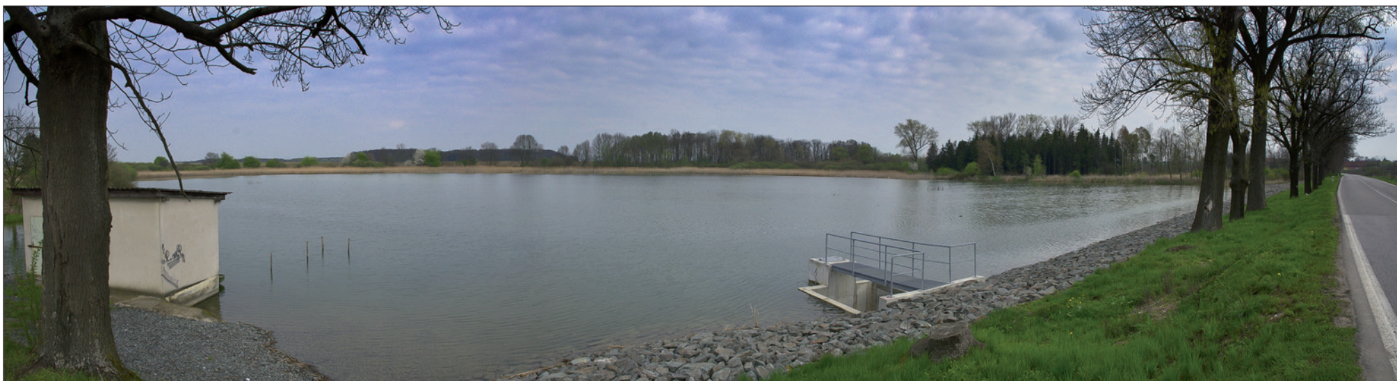
Rybník na výjezdu ke Hradci Králové. Jmenuje se „Závěšák“ a patří Kolowratskému rybářství. Pěkně opravený.