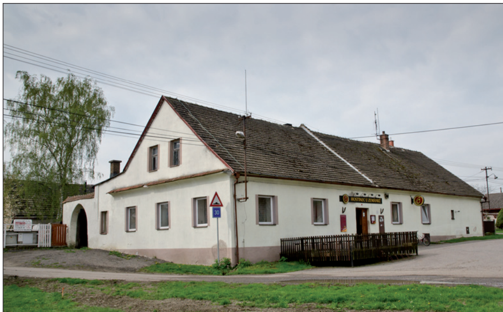
Hospoda „U Zemánků“ je historický objekt v obci. A stále v plném provozu.