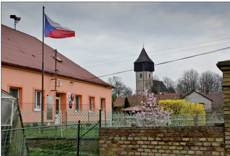
Upravená budova obecního úřadu v pozadí s kostelem sv. Zikmunda..