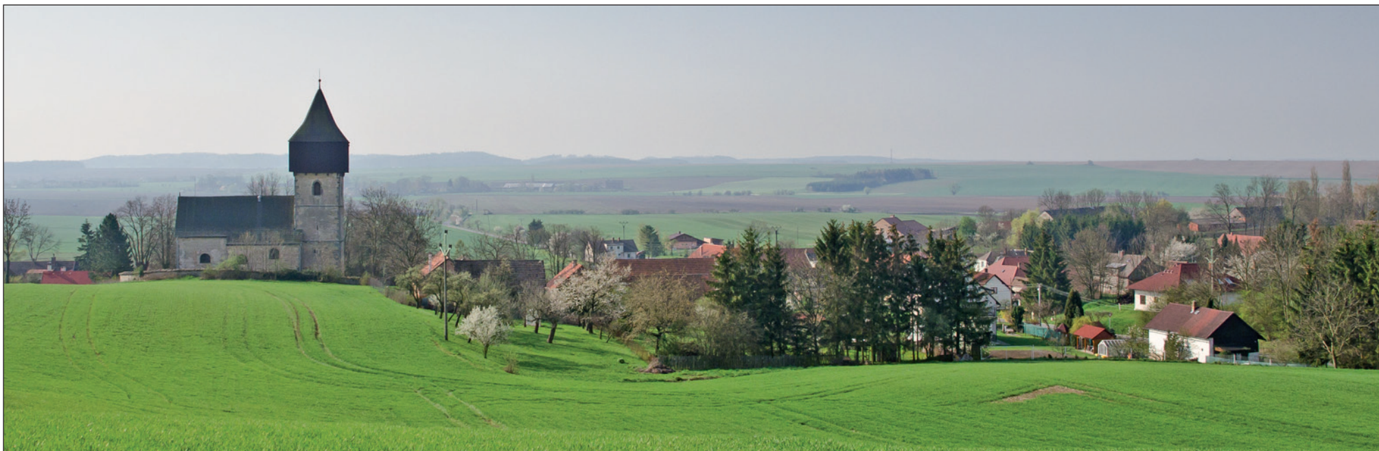
Pohled na centrální část obce od severovýchodu s Lhoteckého kopce..