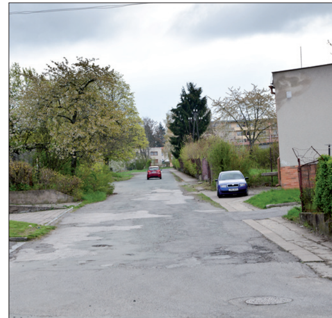
Kasárenská ulice - letos se v této ulici objeví pouliční osvětlení - to je dobrá zpráva.

Doufejme, že se tam objeví i název ulice.