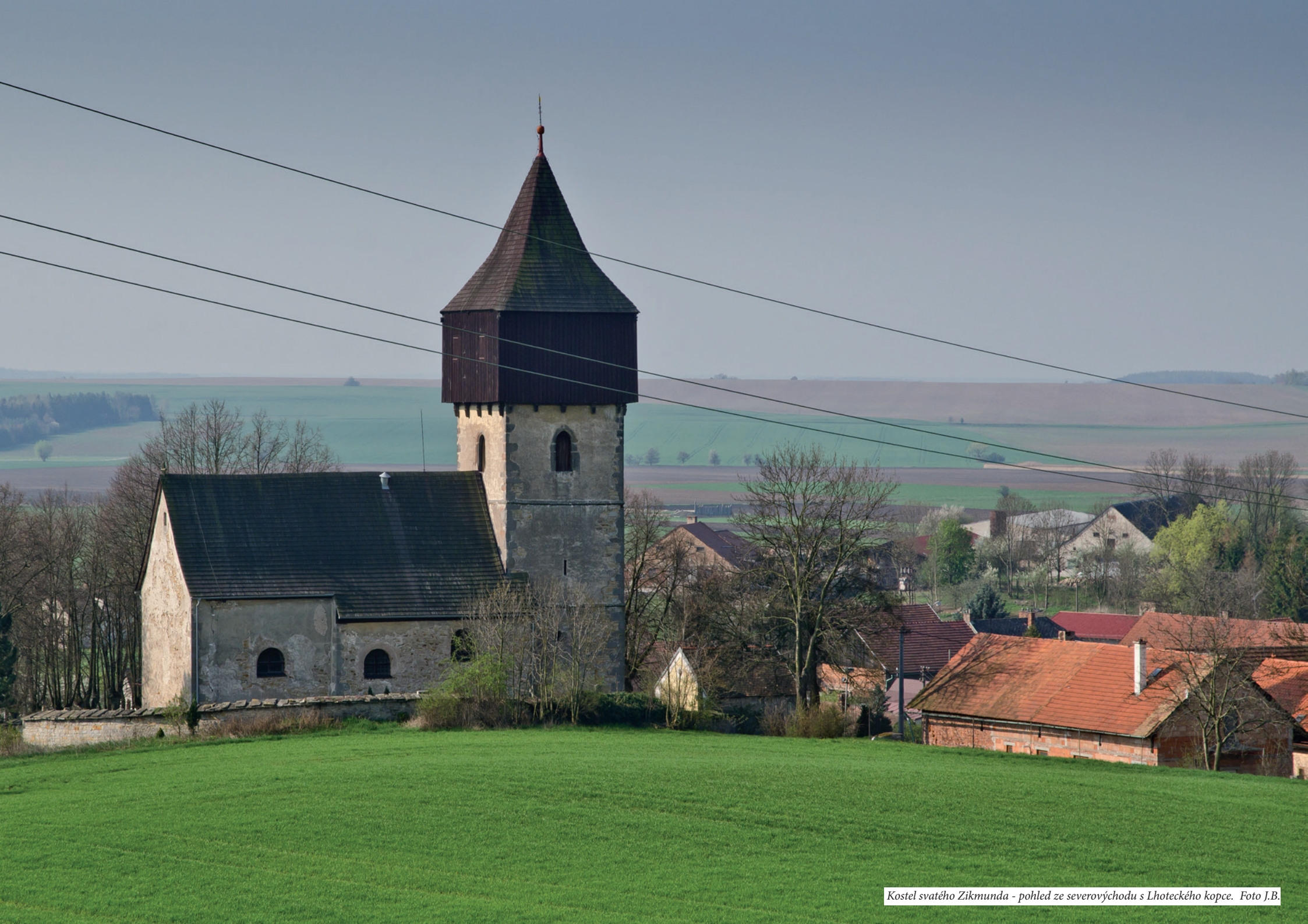
Kostel svatého Zikmunda - pohled ze severovýchodu s Lhoteckého kopce.