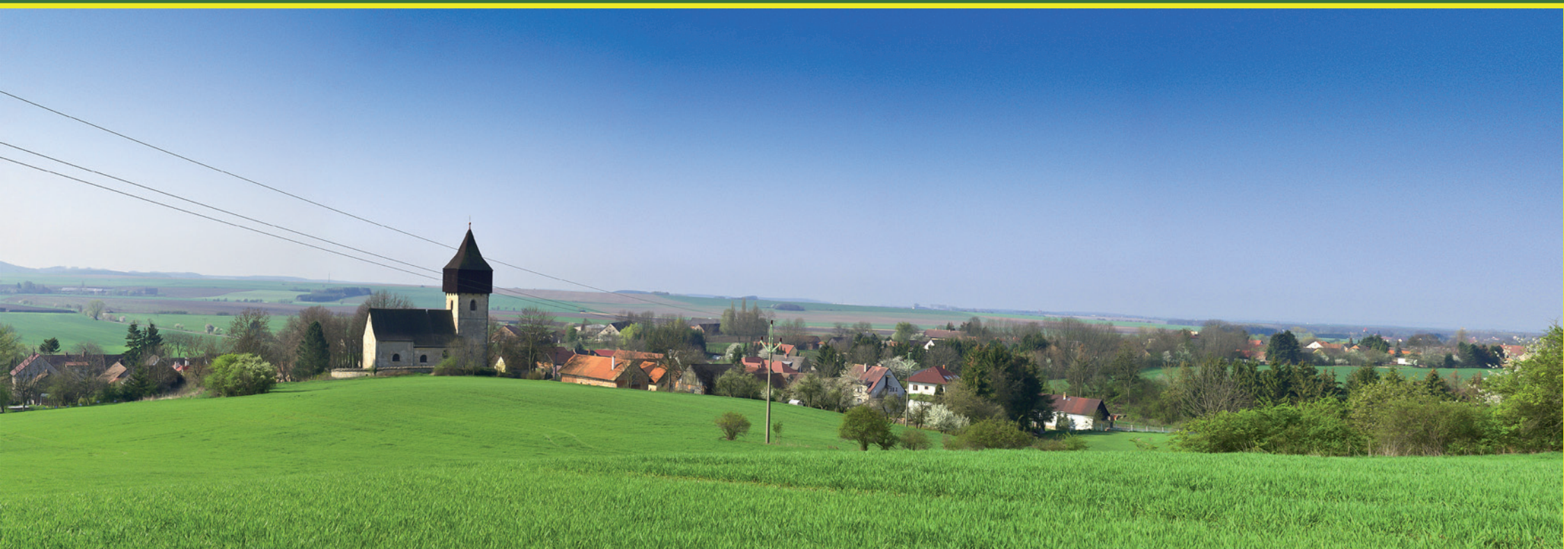
Králova Lhota - pohled z Lhoteckého kopce severovýchodně od obce.