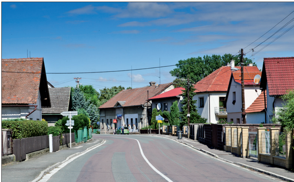
Příjezd od Opočna do středu obce, v zatáče hostinec..