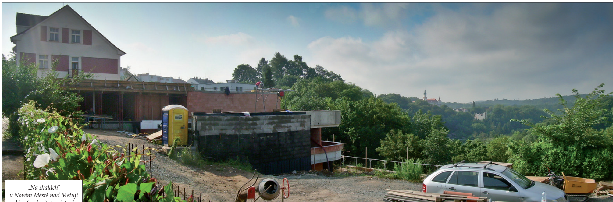
„Na skalách“ v Novém Městě nad Metují zdárně pokračuje výstavba atraktivního objektu na atraktivním místě.