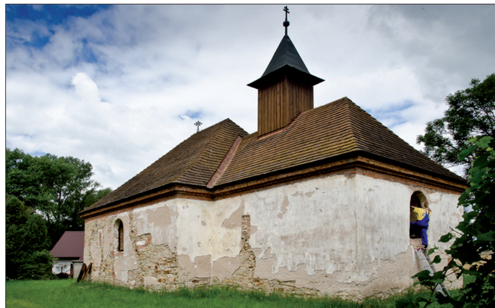
Starobylý kostelík sv. Jana Křtitele v Klášteři - bohužel již hodně sešlý, ale nová střecha naznačuje, že ho čekají lepší časy.

Předpokládám, že toto je zbytek tzv. „Ledeckého dvora“, tedy místo, kde kdysi stával i ledecký cukrovar. Pokud se pletu, prosím starousedlíky o informaci.