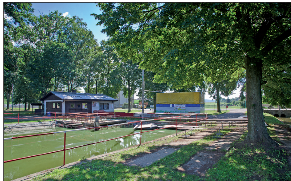
Pohled na sportovní areál s bazénem, kde se pořádá „Ledecká lávka“.