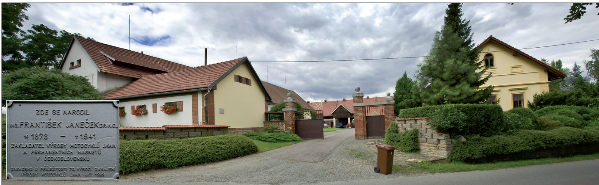
Místo, kde se narodil František Janeček - tvůrce značky JAWA.

ZDE SE NARODIL ING. FRANTIŠEK JANEČEK DR. R. C. * 1878 - † 1941 ZAKLADATEL VÝROBY MOTOCYKLŮ JAWA A PERMANENTNÍCH MAGNETŮ V ČESKOSLOVENSKU ZASAZENO U PŘÍLEŽITOSTI 70. VÝROČÍ ZARÁŽENÍ VÝROBY MOTOCYKLŮ JAWA 4/7 1988