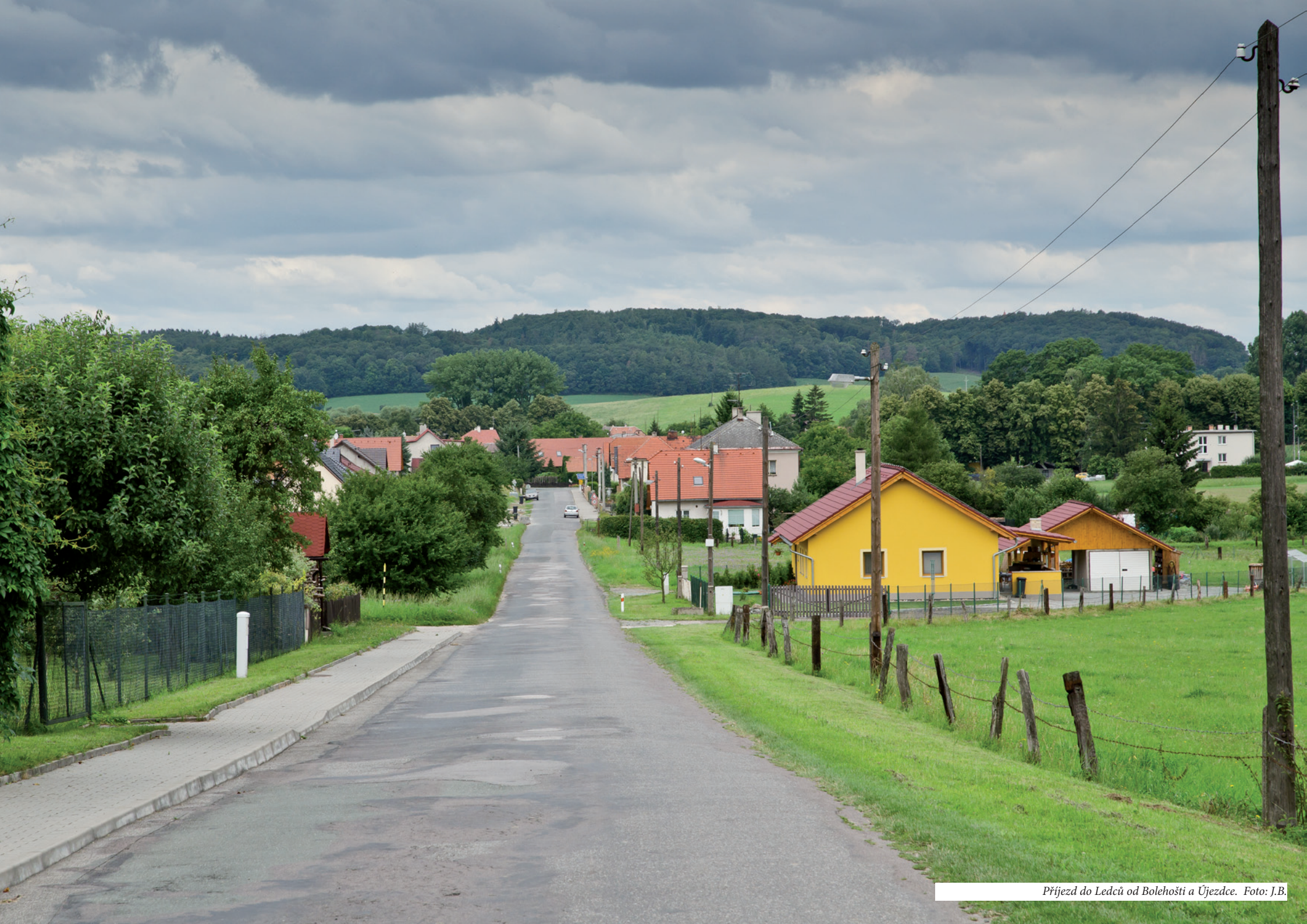
Příjezd do Ledců od Bolehošti a Újezdce.