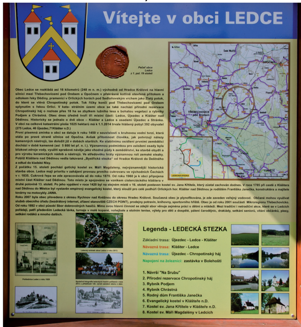
FOTO Z OBCE LEDCE, KLÁŠTERA A ÚJEZDCE