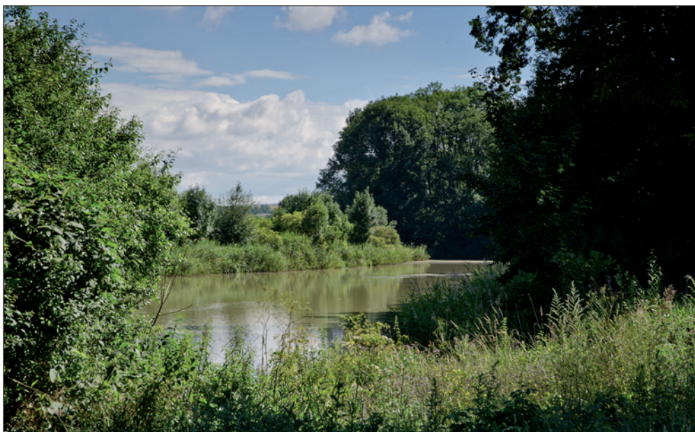
Rybník Podjem v polích nad obcí Ledce.