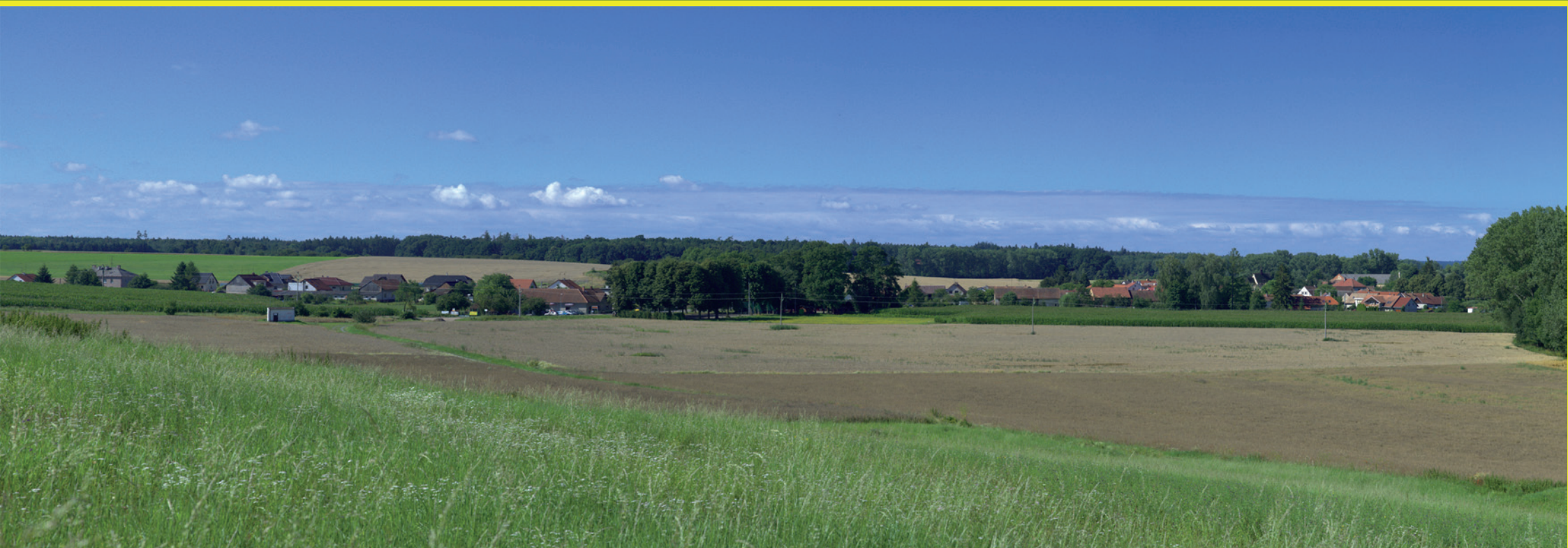
Jihovýchodní část obce Ledce od severovýchodu.