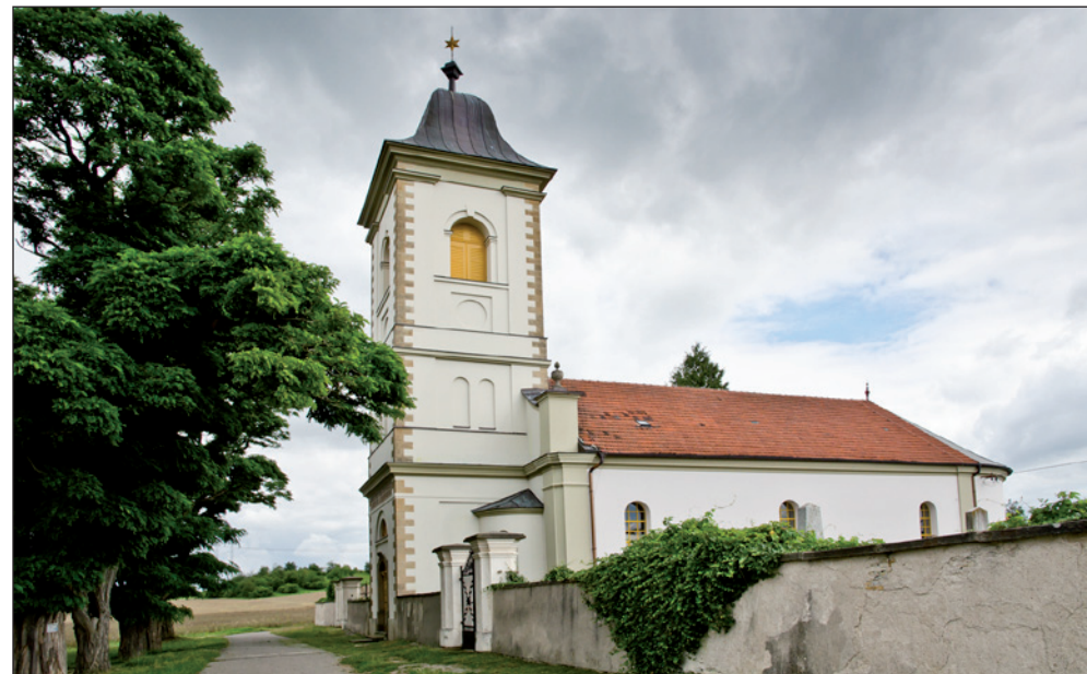
Evangelický kostel na kopečku za Klášterem nad Dědinou.