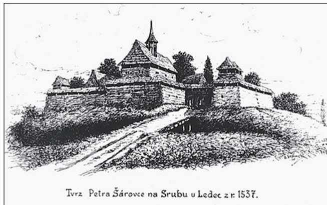
Tvrz Petra Šárovice na Srubu u Ledec z r. 1537.

Území ledecké patřilo údajně ke klášteru Svaté Pole. Ledecská tvrz vznikla pravděpodobně již ve 14. století, ačkoliv se