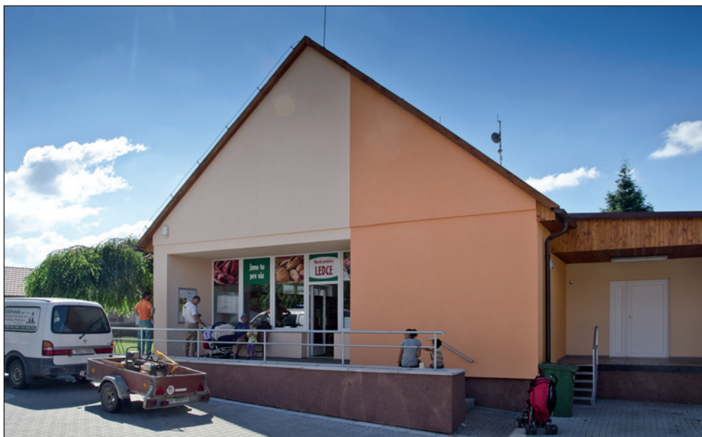
Nová prodejna v centru obce Ledce.