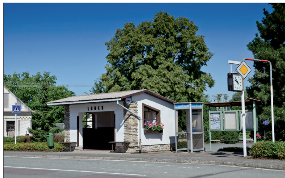
Střed obce Ledce s vkusnou autobusovou zastávkou.