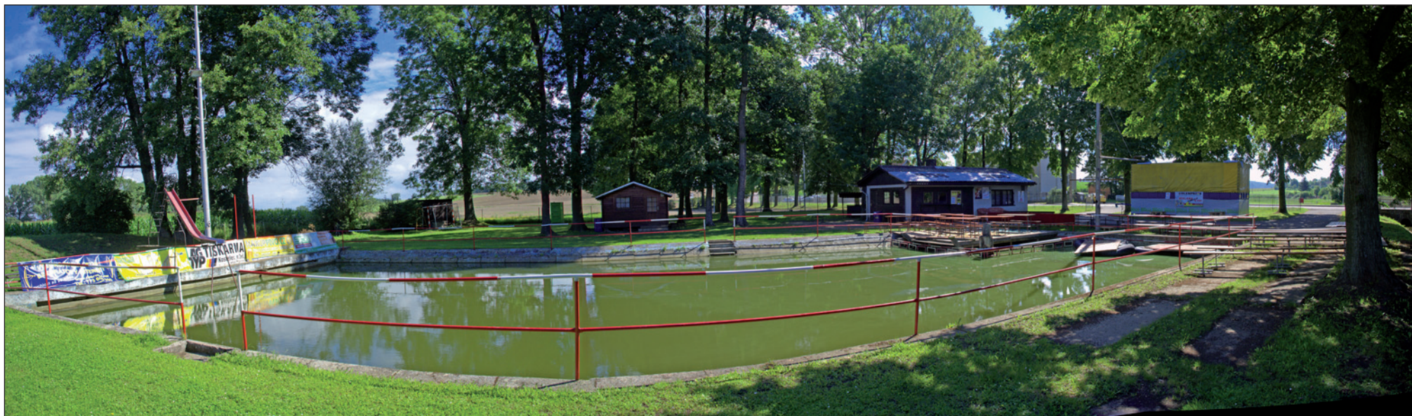
Sportovní areál v Ledčích - zde se také pořádá „Ledecká lávka“.