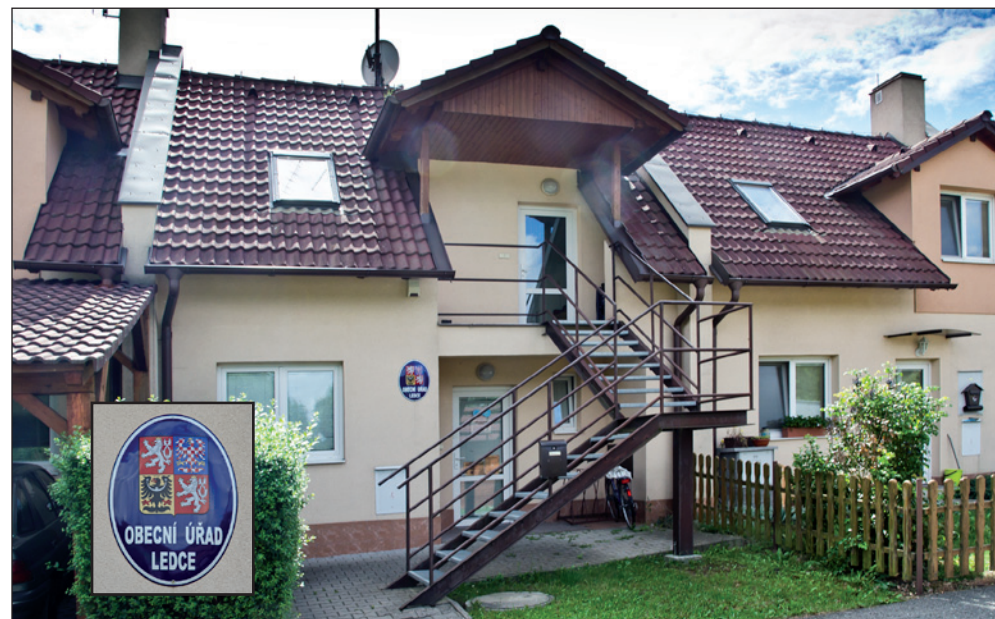
Obecní úřad v Ledcích.