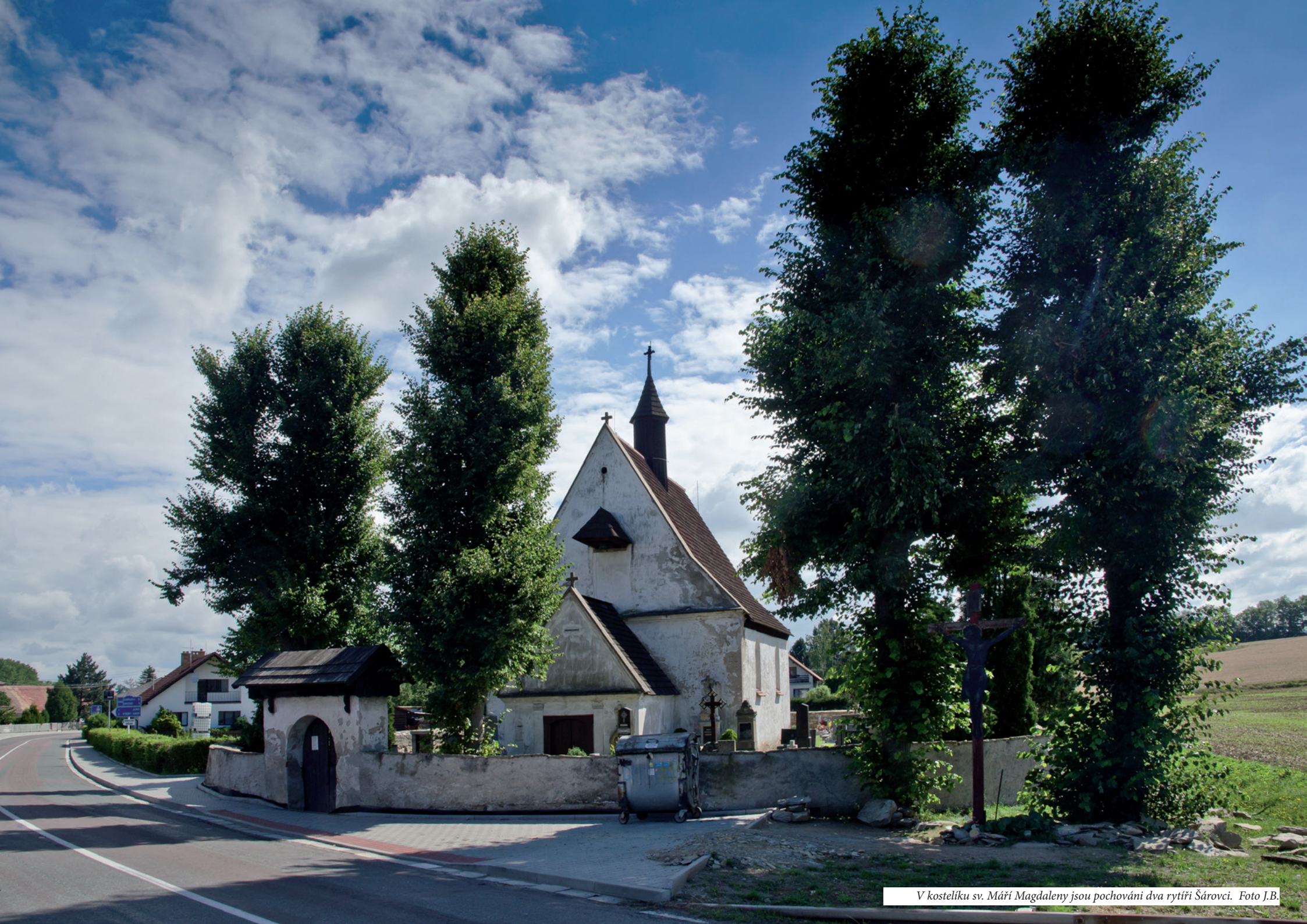
V kostelíku sv. Máří Magdaleny jsou pochováni dva rytíři Šárovci.