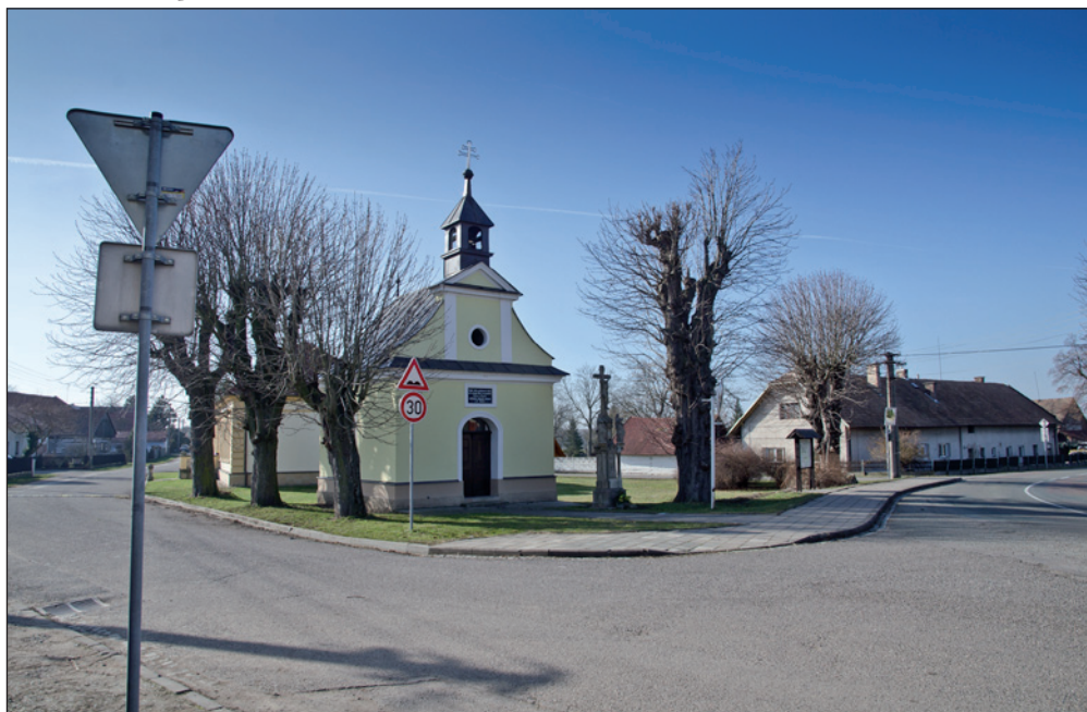
Náves v Očelicích - pohled od severu.