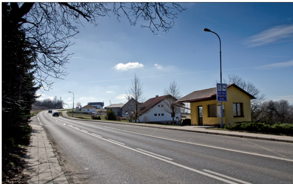
Výjezd z Vrchovin k Novému Městu. Prostor vpravo už je skoro zaplněn novou výstavbou.

Jak je vidět, ve Vrchovinách to mají stavebníci v oblíbě..