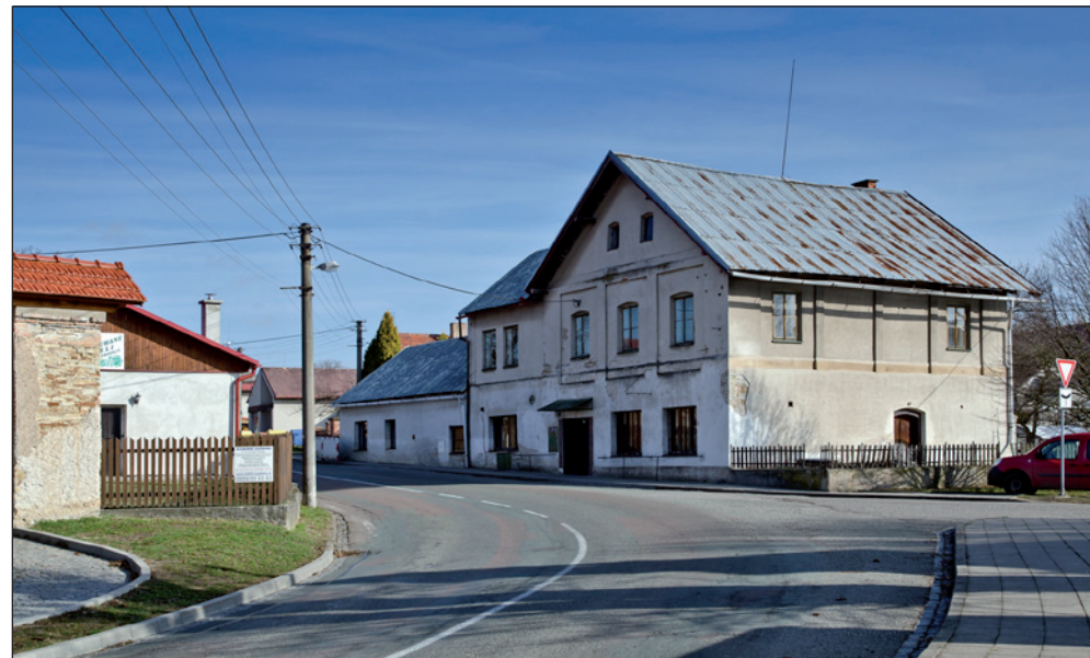
Na první pohled hospoda. V centru obce. Ale zasloužila by si trochu osvěžení svého vzhledu.