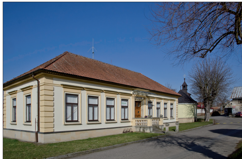
Obecní úřad v Očelicích - bývalá škola.