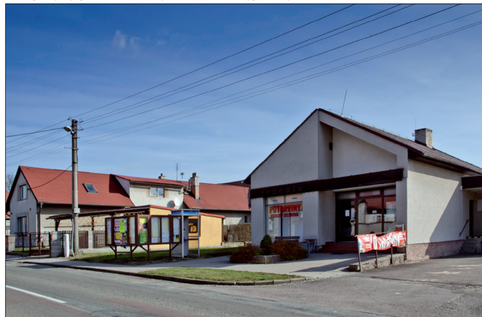
Místní prodejna je pěkná. Snad to není ještě z „Akce Z“? Nevypadá, že jí hrozí zánik.