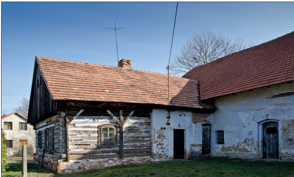
Tak tahle chalupa už určitě něco pamatuje. Netroufni si odhadnout.