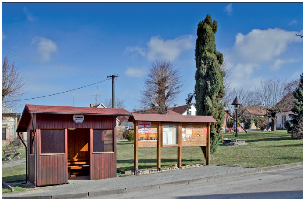
Autobusová zastávka v Městci nad Dědinou umístěná na malebné návsi.