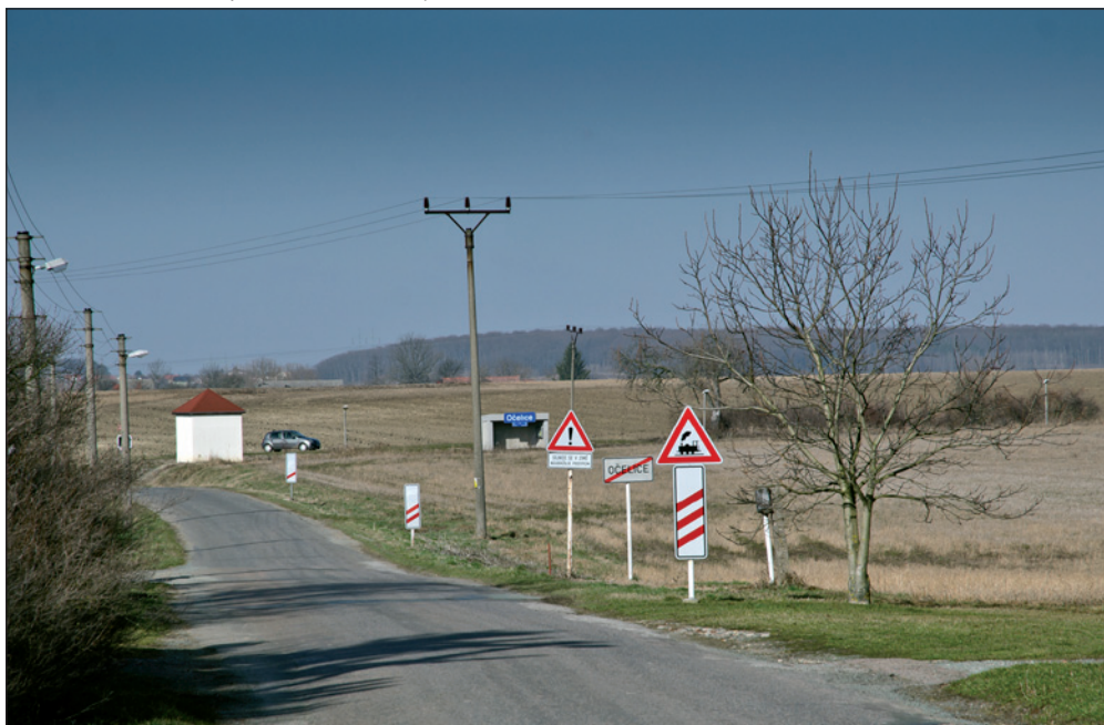
Malinké nádražičko. Ale je důležité, že tu vlaky stávají. Tahle cesta vede k Městci nad Dědinou. Je to kousek.