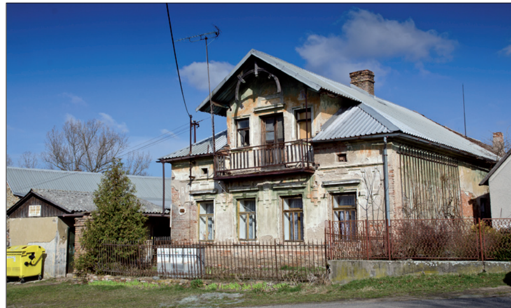
Náznak výstavnosti jednoho z domů na návsi v Městci nad Dědinou.