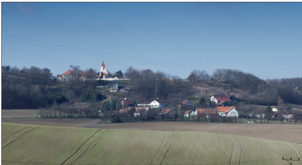
Toto je pohled s kopce „Humbule“ u Městce nad Dědinou na Vysoký Újezd.

Zajímavá usadlost na výjezdu z Městce nad Dědinou k Vysokému Újezdu.