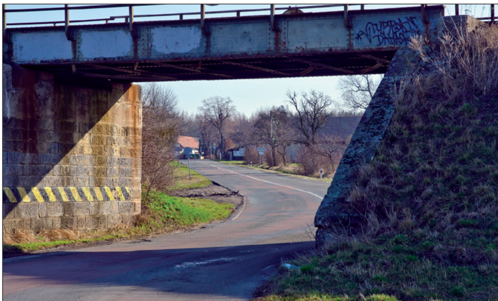
Příjezd do Očelic od Třebechovic.