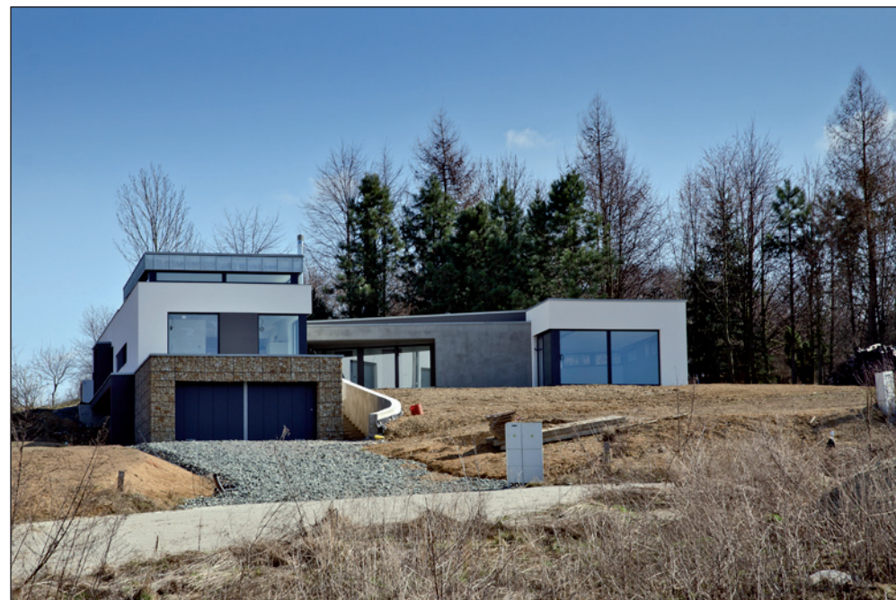
Tento atraktivní objekt je umístěn vlevo nad silnicí.

Tyto objekty se objevily v této lokalitě jako první. Atraktivní místo s atraktivním výhledem. Co myslíte, byl by zájem o výstavbu směrem k Novému Městu? Prostor pro výstavbu by tam byl. Jenže městu se zalíbilo tam umístit tranzitní silnici.