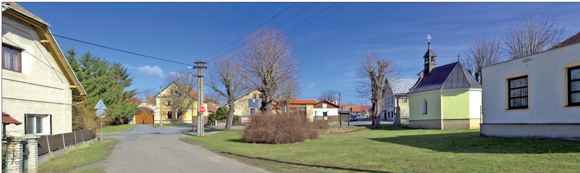
Pohled na náves v Očelících.