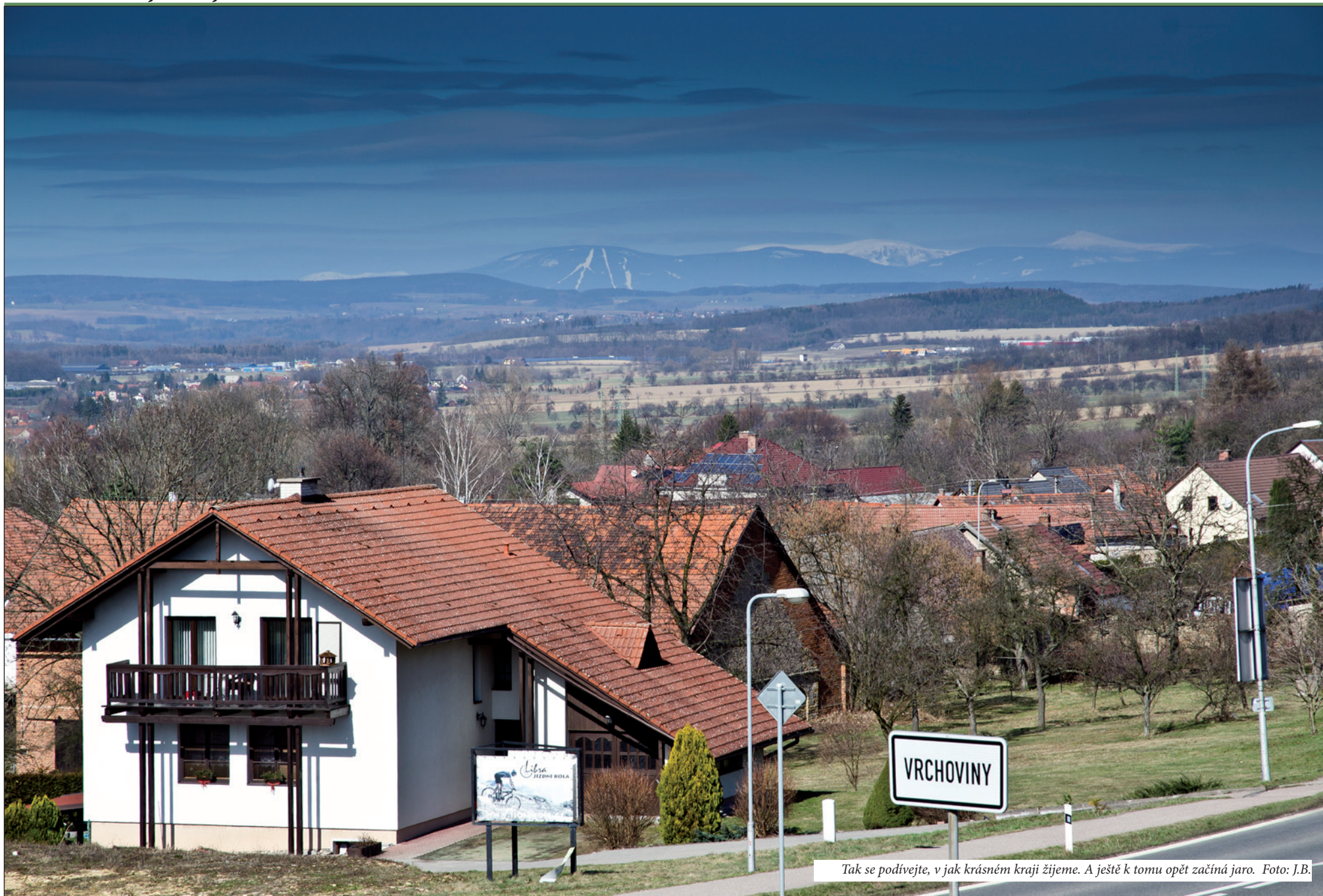
Tak se podívejte, v jak krásném kraji žijeme. A ještě k tomu opět začíná jaro.