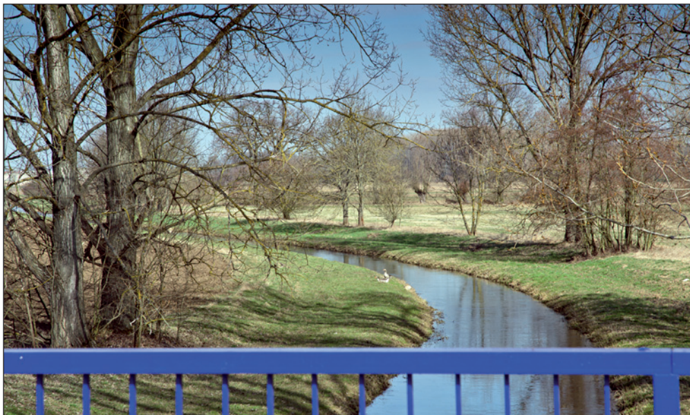
Takhle vypadá říčka Dědina když nezlobí. Ale umí se docela pěkně rozdovádět.