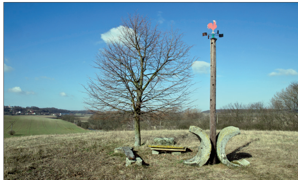
Vrcholek kopce „Humbule“. Vypadá to skoro jako nějaké obřadní místo. Včetně toho červeného kohouta.

A zde máme pohled do Městce nad Dědinou z toho jejich krásného nového mostu. Jak se vlastně ten Městec jmenuje?