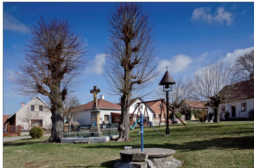
A toto je ta slavná čtvercová náves, která naznačuje, že Městec mohl být městem.