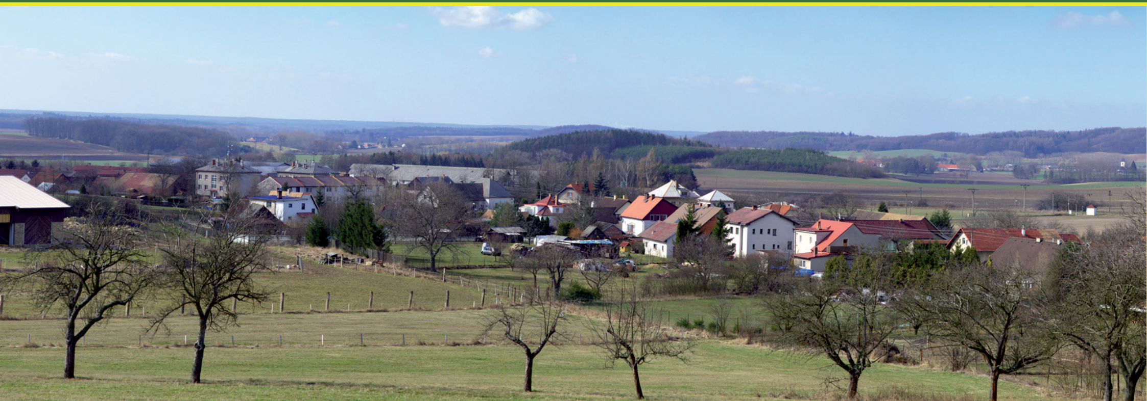
Pohled na Očelice od severovýchodu - s návrší s vodárnou.