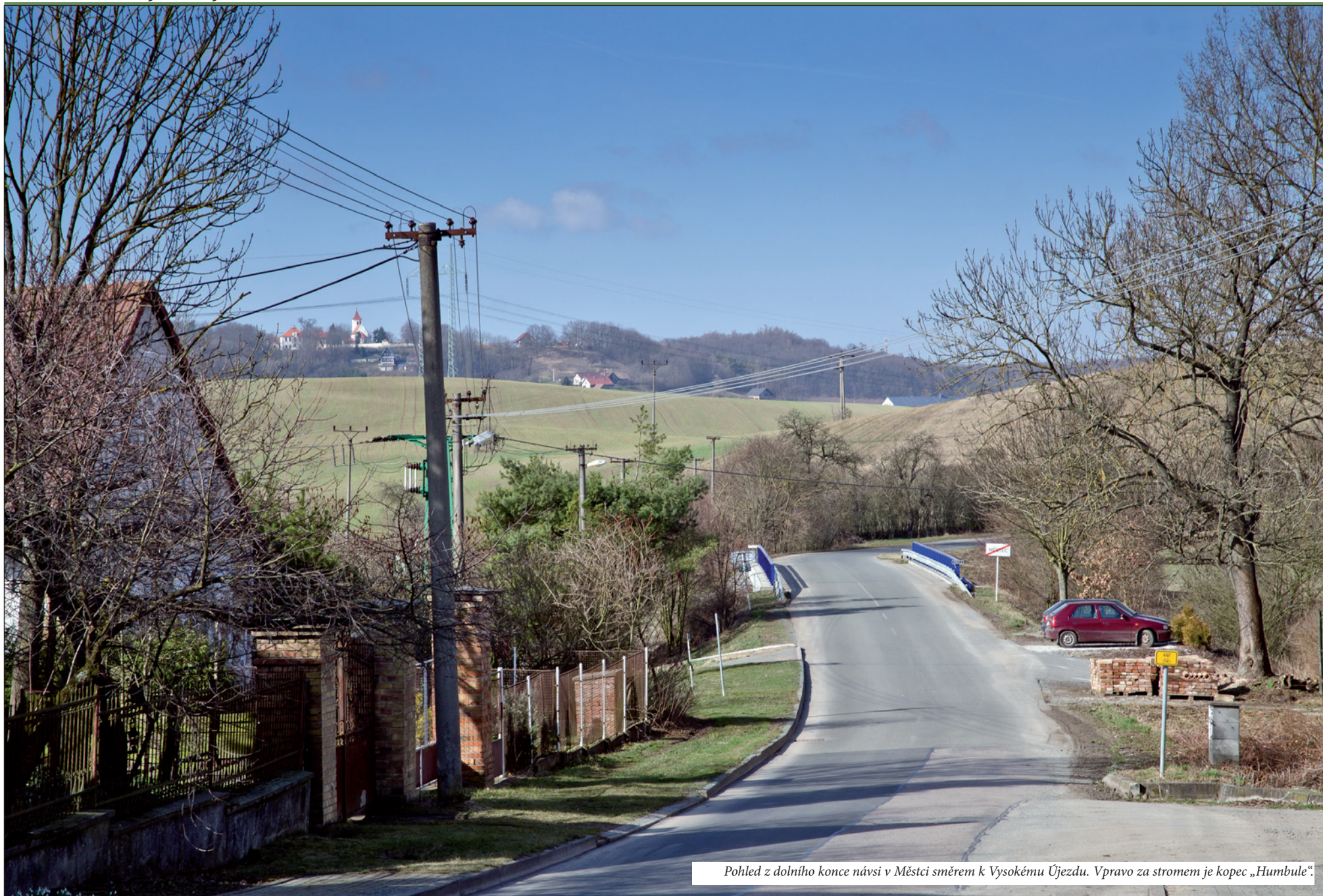
Pohled z dolního konce návsi v Městci směrem k Vysokému Újezdu. Vpravo za stromem je kopec „Humbule“.