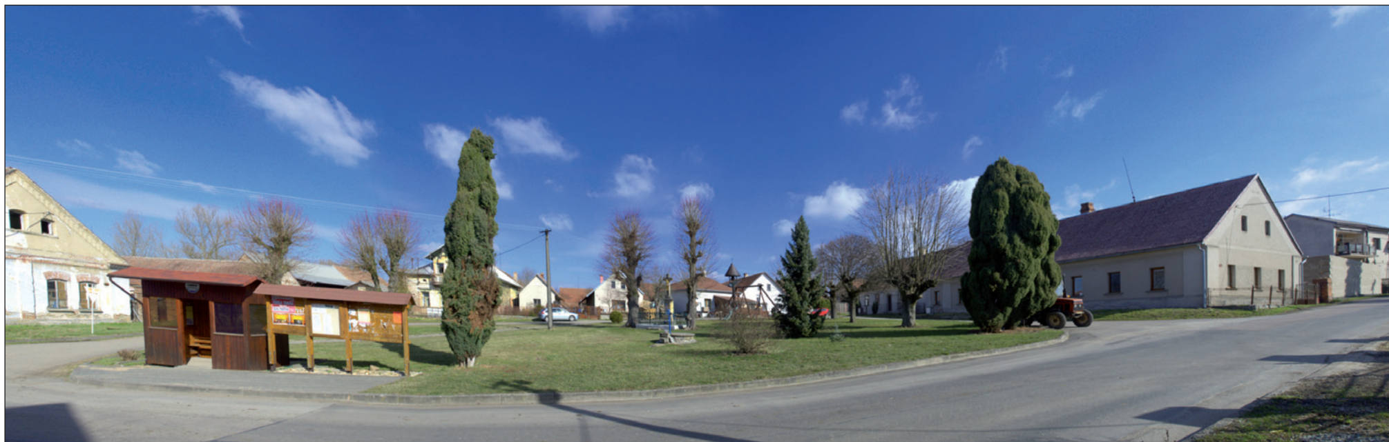
Celkový pohled na náves v Městci nad Dědinou. Je tam vše důležité - křížek, zvonička, studna, ozdobné stromy i autobusová zastávka.