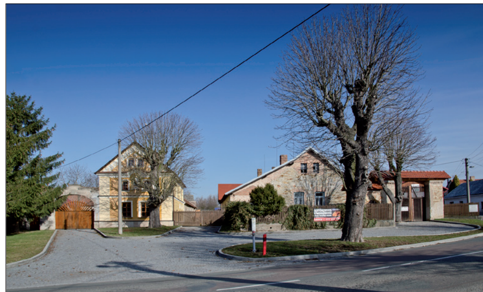
Náves v Očelicích - pohled od jihu.