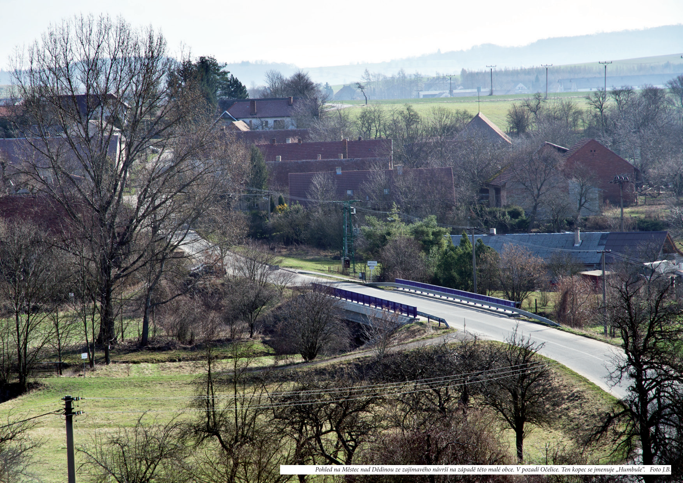
Pohled na Městec nad Dědinou ze zajímavého návrší na západě této malé obce. V pozadí Očelice. Ten kopec se jmenuje „Humbule“.