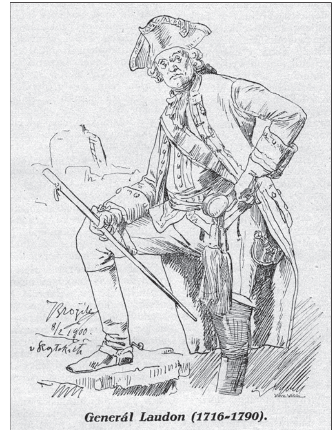
Generál Laudon (1716-1790).

Prusové odtáhli, ale prajské šance na Brance vytrápovaly okolní robotníky ještě několik let po vojně! Roku 1781 stěžují si běloveci a staroměstští, že nejen robotu polní musí řádně vybývat, cesty spravovat, ale z roboty rozhazují i šance po Prúších i našich. A k tomu, když z Plesu (Josefova) výstřelem dají znamení, že některý voják »desentýroval«, aby hlídali po celý den i v noci hranice, zatím co kordonisté po chalupách se provalují. A jak by se na »Mařenkáře« — tak přezdívali kordonistům — nedohřáli, když