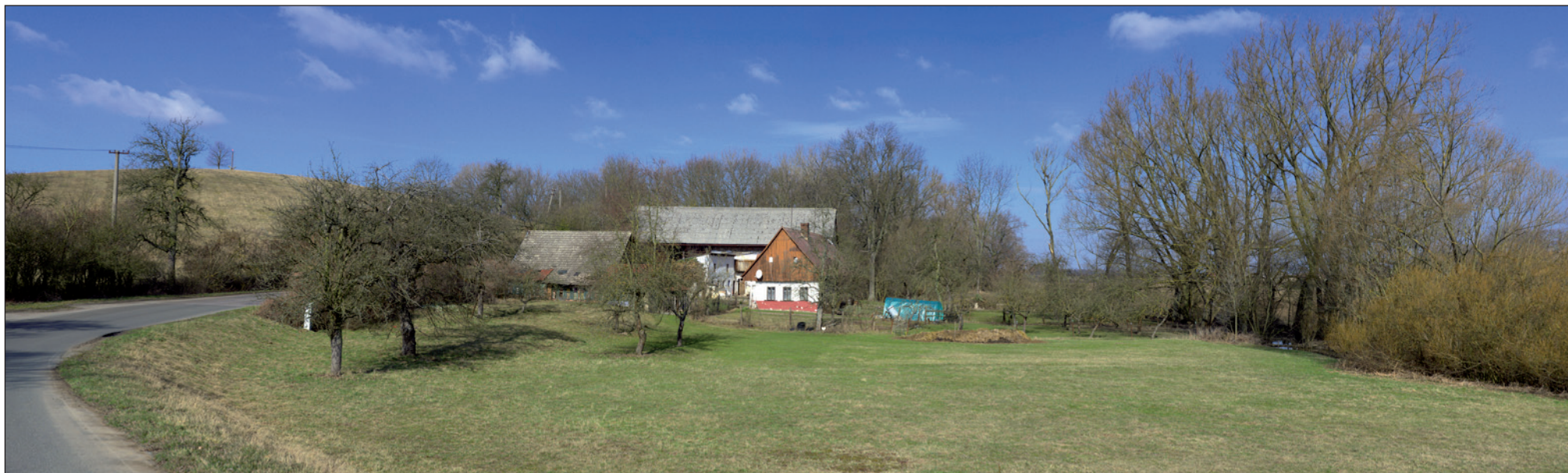
Výjezd z Městce nad Dědinou směrem na Vysoký Újezd. Vlevo kopec „Humbule“, uprostřed romantická usedlost.