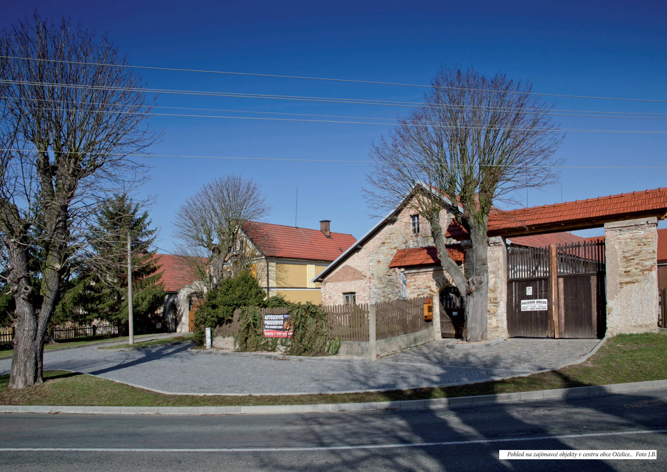
Pohled na zajímavé objekty v centru obce Očelice..